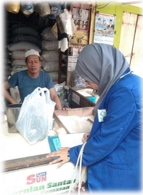
Wawancara Pedagang Beras