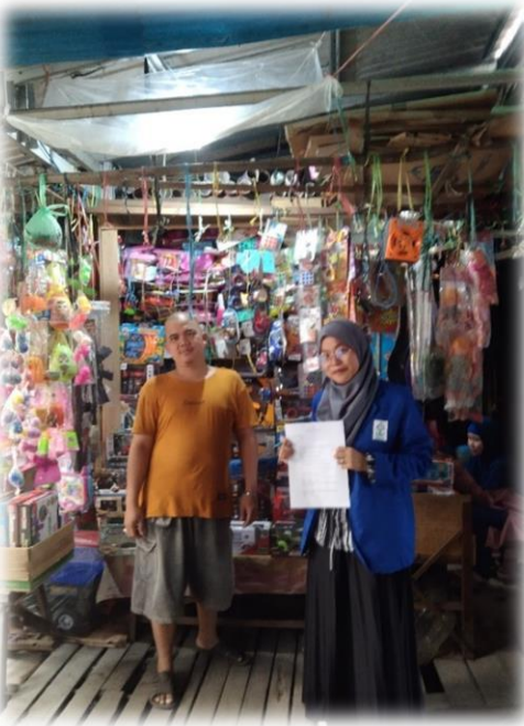
Wawancara Pedagang Mainan