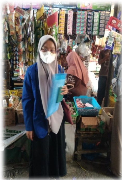
Wawancara Pedagang Sembako