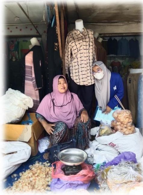
Wawancara Pedagang Kerupuk