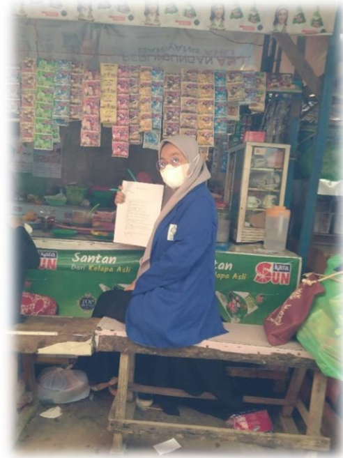
Wawancara pedagang Depot Minuman