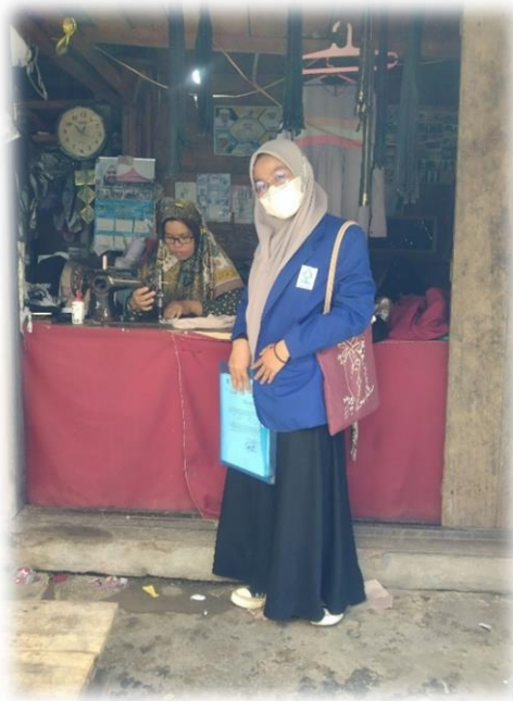
Wawancara Pedagang Alat Jahit