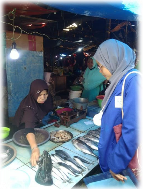
Wawancara pedagang Ikan