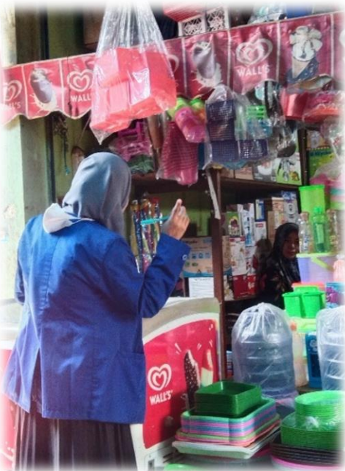
Wawancara Pedagang Pecah Belah