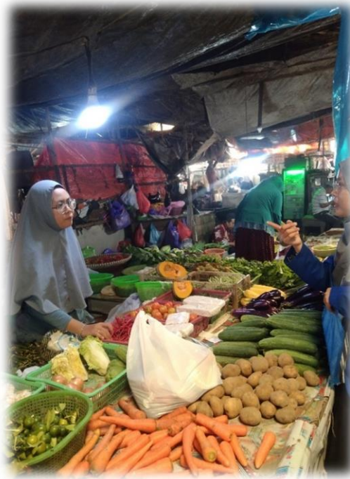
Wawancara Pedagang Sayur