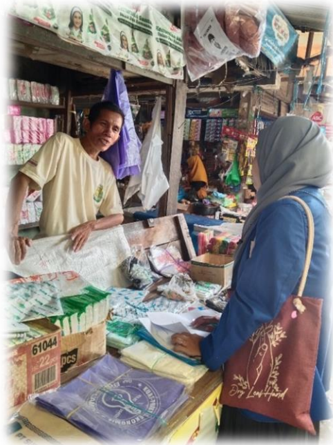
Wawancara pedagang Plastik