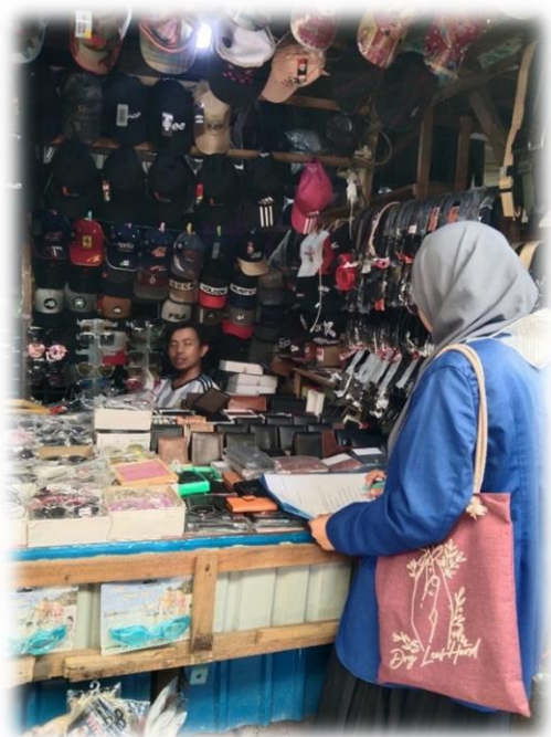
Wawancara pedagang Aksesoris