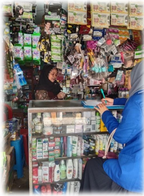
Wawancara Pedagang Kosmetik