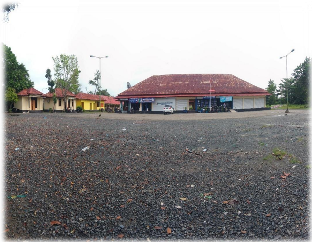
Pasar Gambut Baru