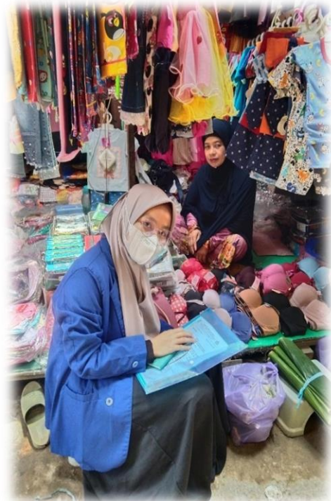
Wawancara pedagang Pakaian