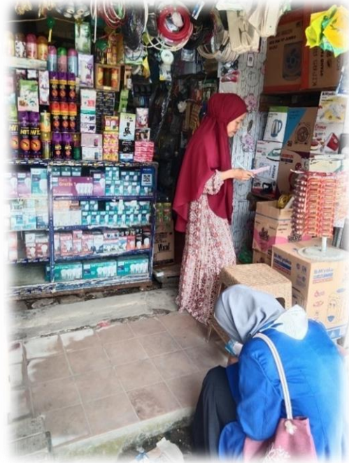
Wawancara Pedagang Elektronik