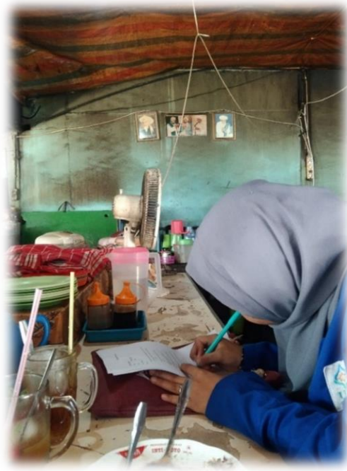
Wawancara pedagang Depot Makanan