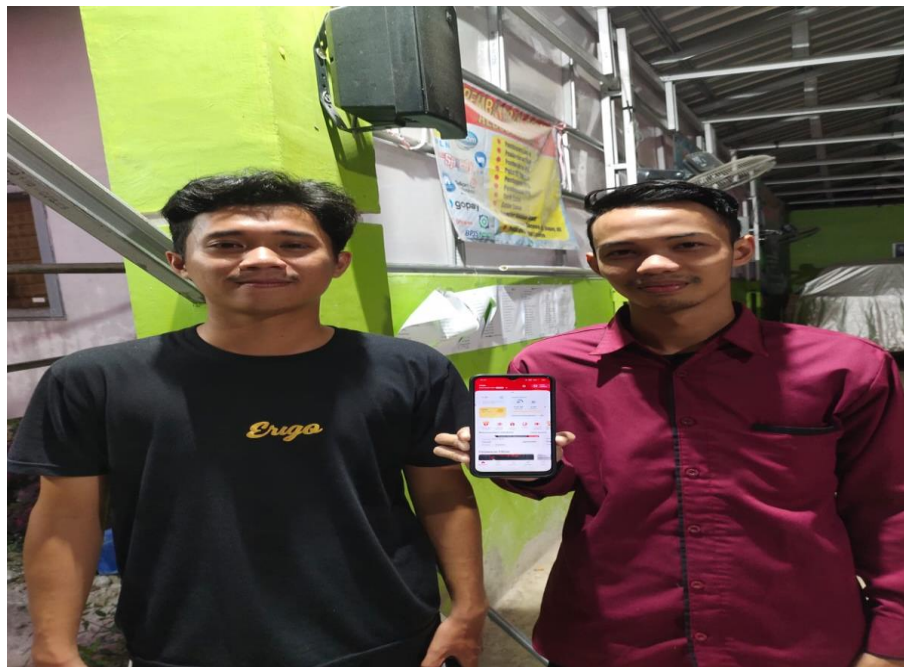
Wawancara Bersama Hafiz Pengguna Telkomsel