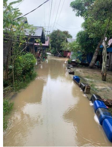
Jalanan belum di aspal