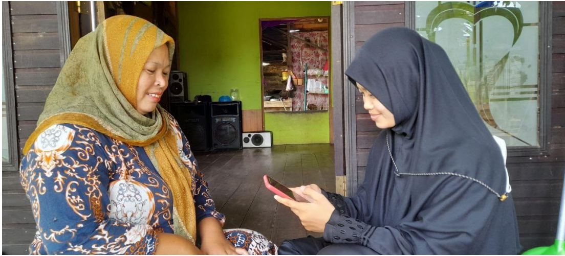
Wawancara bersama Ketua RT 1 Desa Murung Panti Hilir musidah