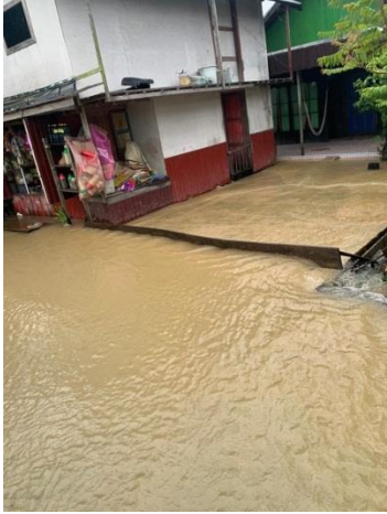
Banjir tiap turun hujan deras