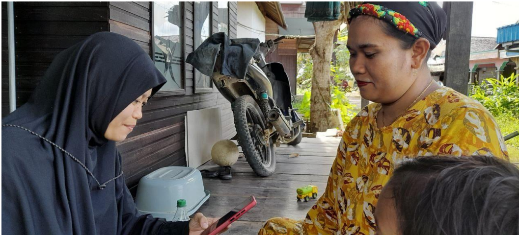
Wawancara bersama Ketua RT 5 Desa Murung Panti Hulu Baiti