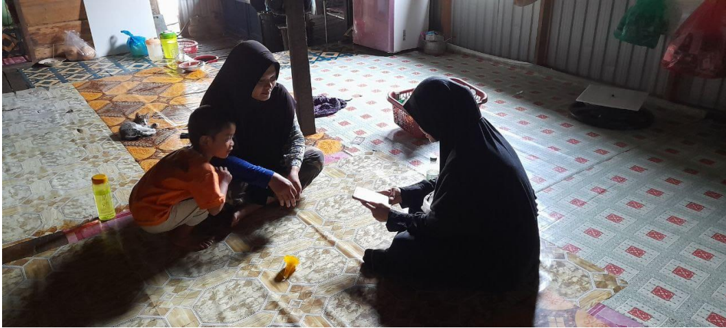
Wawancara bersama Ketua RT 1 Desa Murung Panti Hulu Nurita