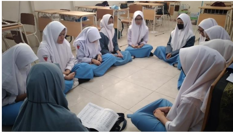
Suasana Program Tahsîn dan Tahfiz Al-Qur'an berlangsung