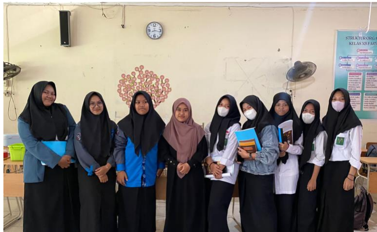
Wawancara bersama para siswa