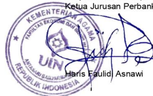
Haris Faulid Asnawi

Banjarmasin, 28 September 2020 Ketua Jurusan Perbankan Syariah