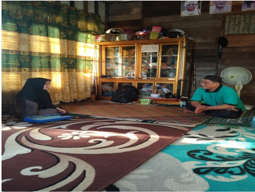
Bapak N (Tokoh Masyarakat)