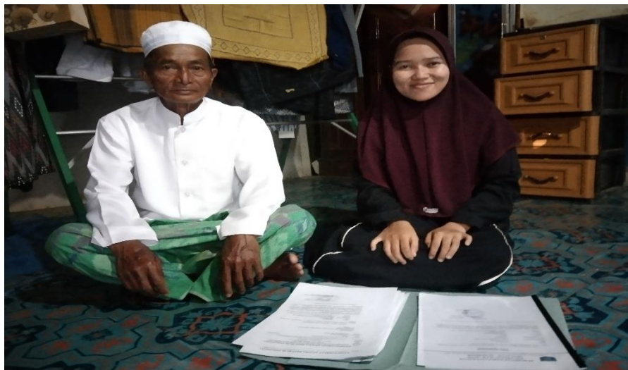
Bapak I ( Tetua Masyarakat )