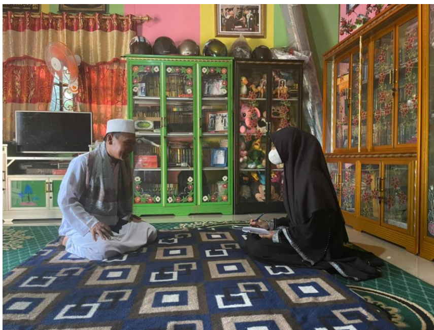
Foto 1 merupakan gambar wawancara yang dilakukan pada tanggal 14 Mei 2023.

Foto 2 merupakan gambar wawancara yang dilakukan pada tanggal 21 Mei 2023.