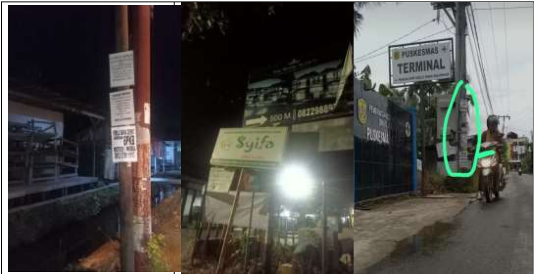
Iklan yang sembarangan dan tanpa izin