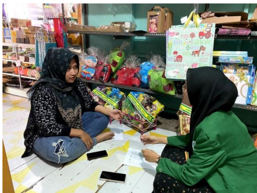
Gambar 2 Foto Proses wawancara Bersama Narasumber