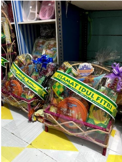
Gambar 4 Foto Hasil Produksi 1