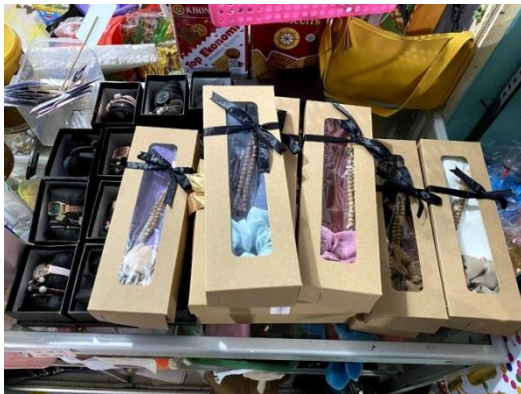
Gambar 6 Foto Hasil Produksi 3