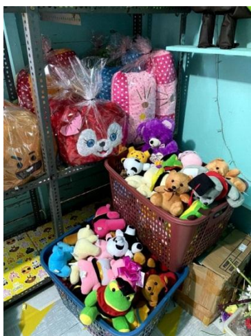
Gambar 8 Foto Hasil Produksi 5