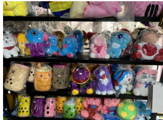
Gambar 7 Foto Hasil Produksi 4