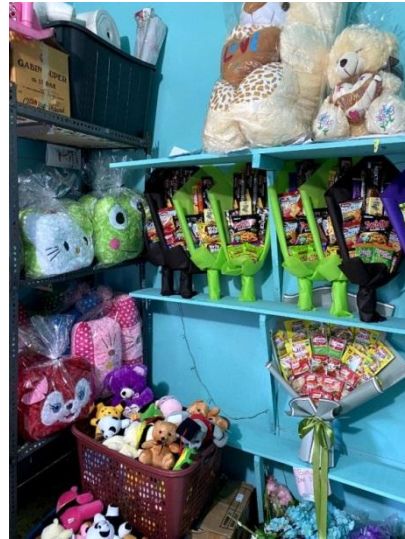
Gambar 5 Foto Hasil Produksi 2