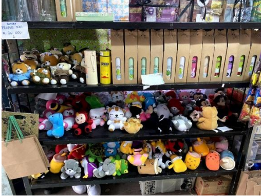
Gambar 10 Foto Hasil Produksi 7