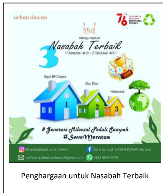
Penghargaan untuk Nasabah Terbaik