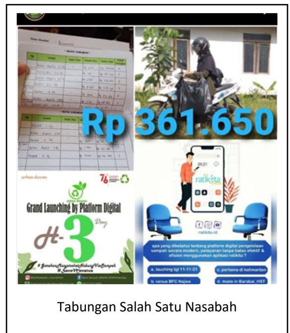
Tabungan Salah Satu Nasabah