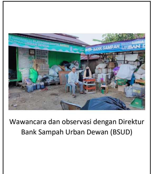
Wawancara dan observasi dengan Direktur Bank Sampah Urban Dewan (BSUD)