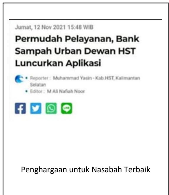
Penghargaan untuk Nasabah Terbaik