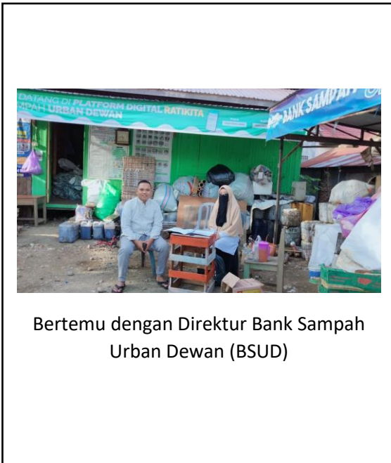
Bertemu dengan Direktur Bank Sampah Urban Dewan (BSUD)