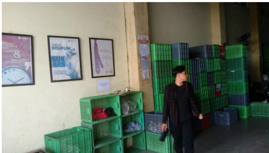
Dokumentasi : Di Gudang SiCepat Ekspres Banjarmasin 15 April 2023