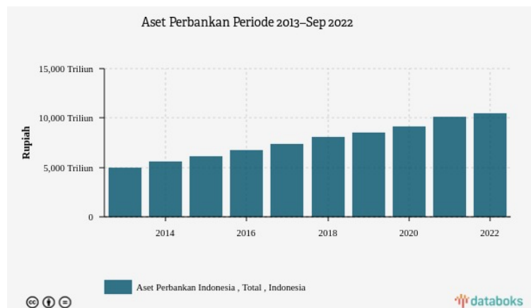
Aset Perbankan Periode 2013-Sep2022