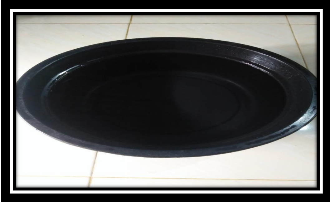
“Media Air Untuk Praktek Pembuka Aura”