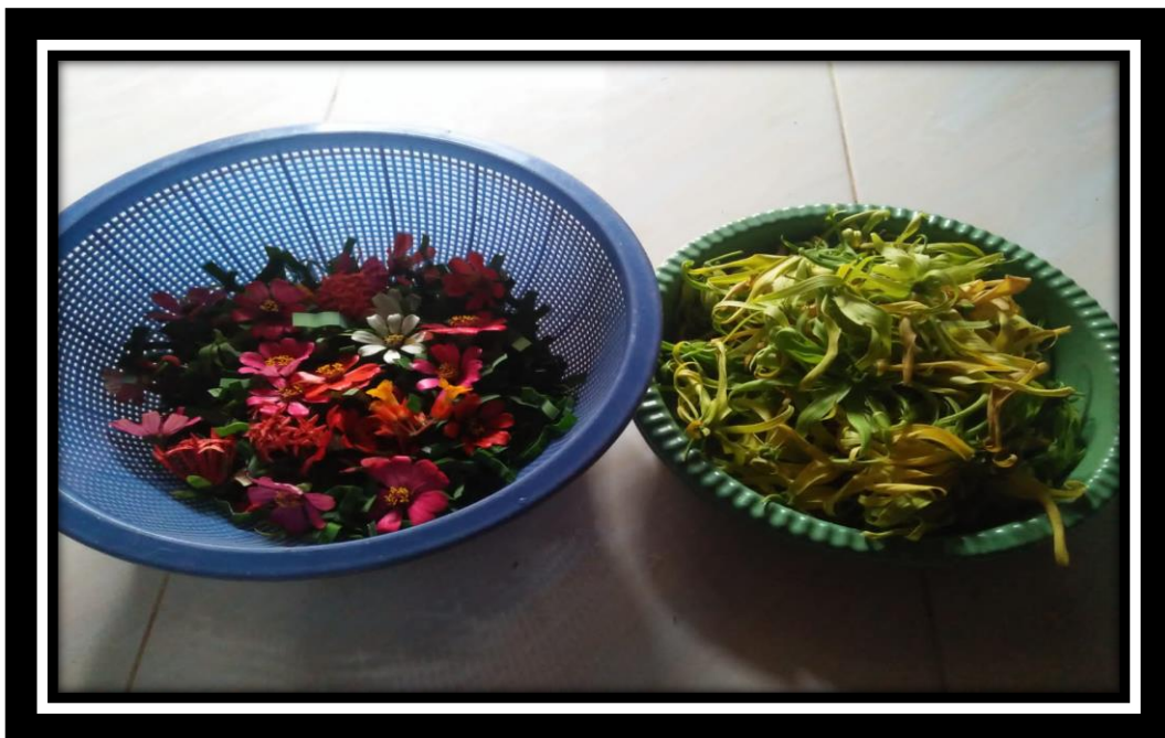
“Media Bunga Untuk Praktek Pembuka Aura”