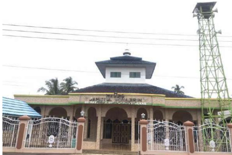
GAMBAR IV LANGGAR-LANGGAR DI DESA MARTADAH