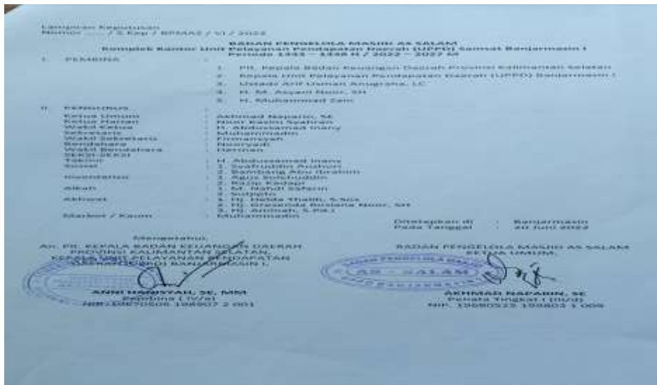
Struktur Kepengurusan Masjid As-Salam