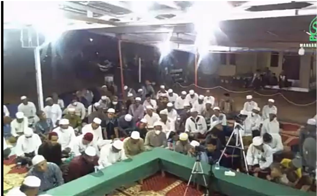
Pengajian Tauhid di Batola Residence