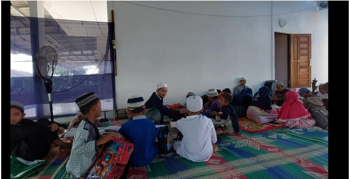
Rumah Pengajian Anak di Batola Residence