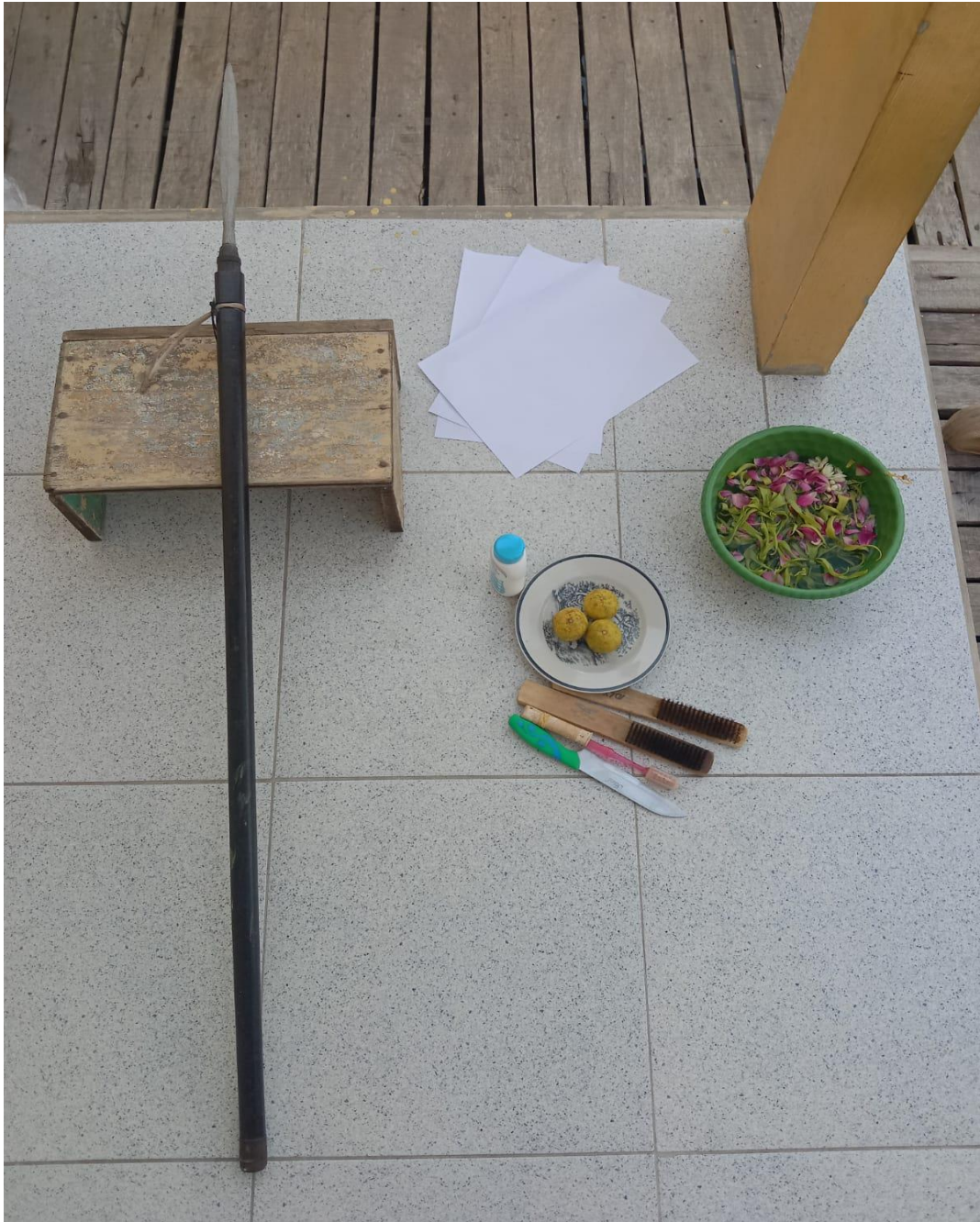
Persiapan Memandikan Tombak Pusaka