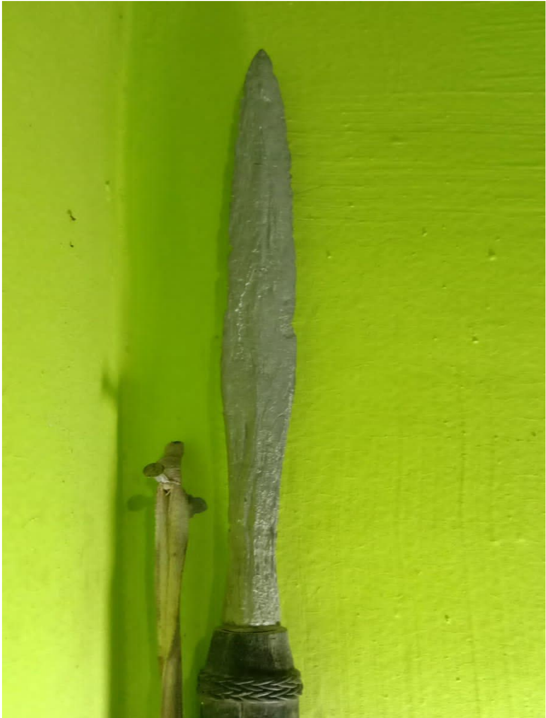
Foto Mata Tombak Pusaka