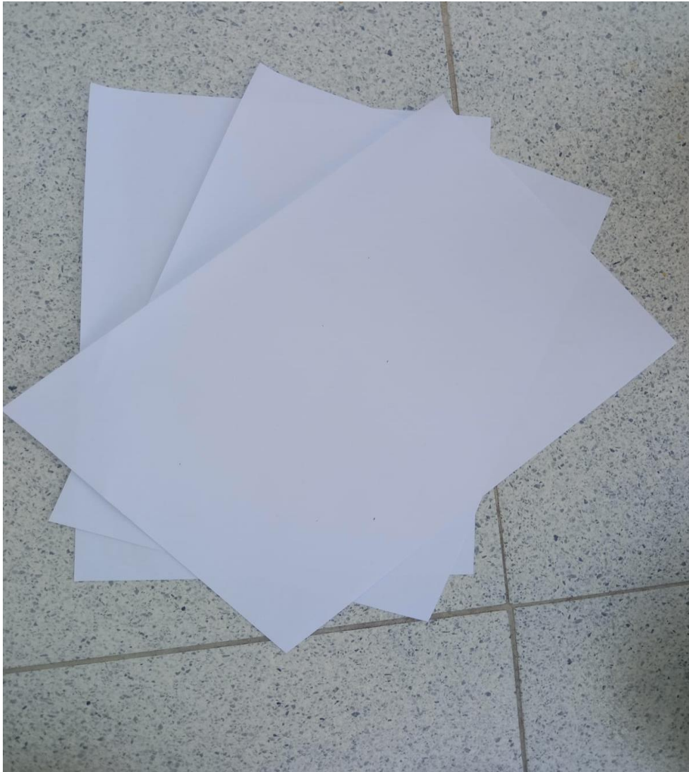
Kain atau Kertas Untuk Memandikan Tombak Pusaka