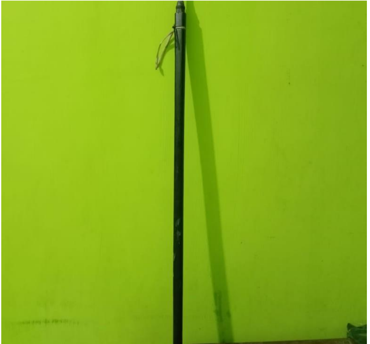
Foto Gagang Kayu Tombak Pusaka