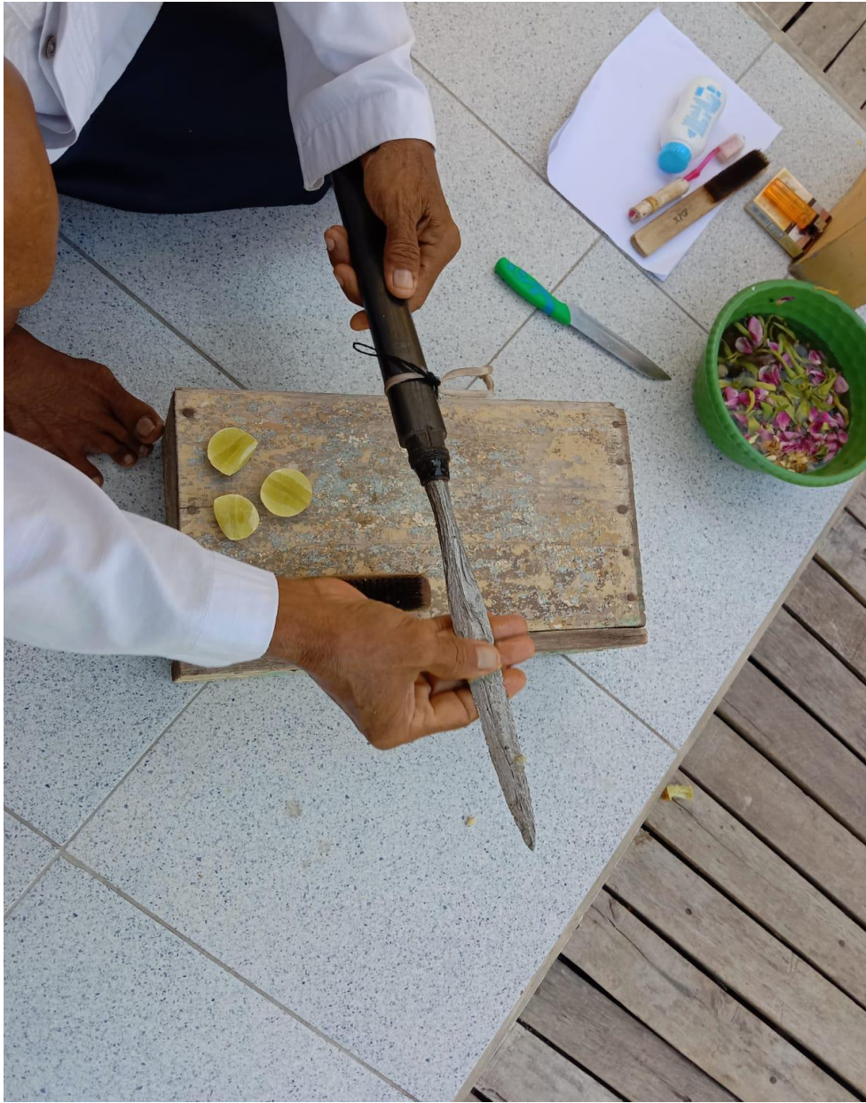
Proses Memandikan Tombak Pusaka