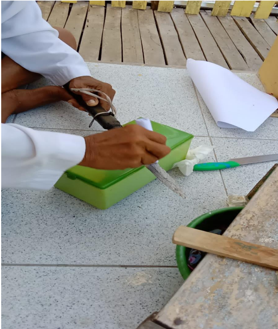
Proses Memandikan Tombak Pusaka