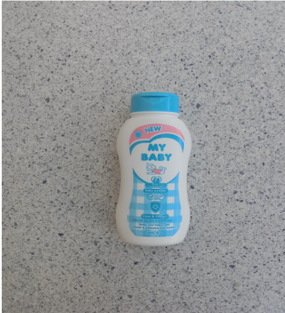
Pupur Baru Untuk Tombak Pusaka