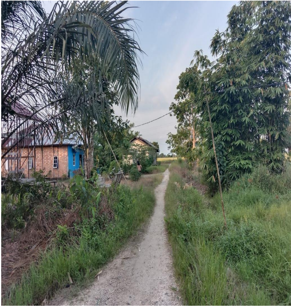
Sungai Gampa Desa Pindahan Baru. Kecamatan Rantau Badauh. Kabupaten Barito Kuala