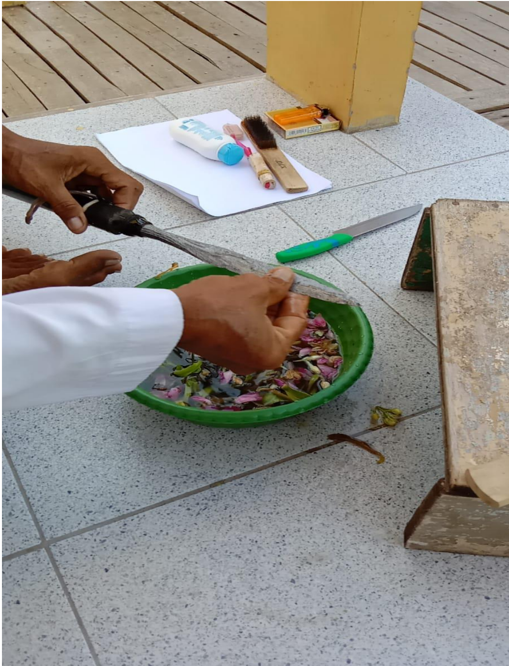
Proses Memandikan Tombak Pusaka