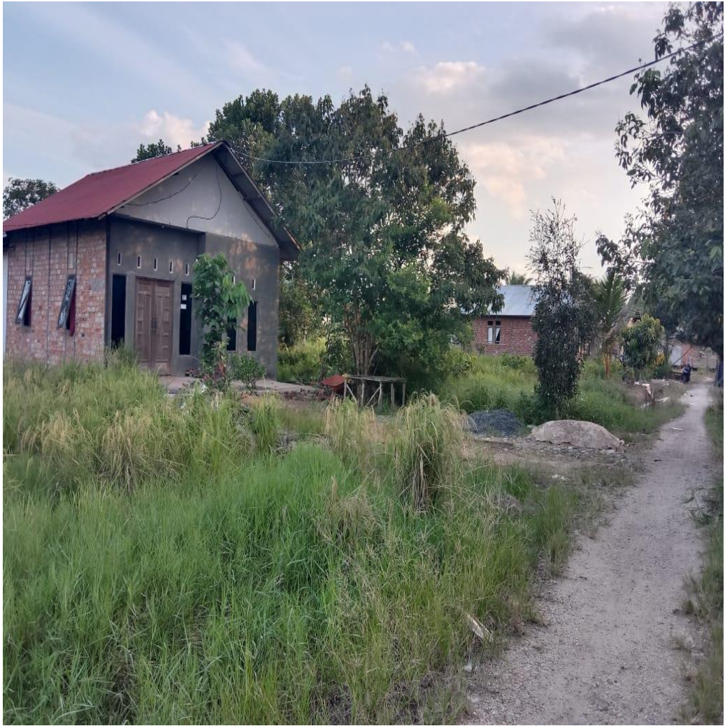
Sungai Gampa Desa Pindahan Baru. Kecamatan Rantau Badauh. Kabupaten Barito Kuala