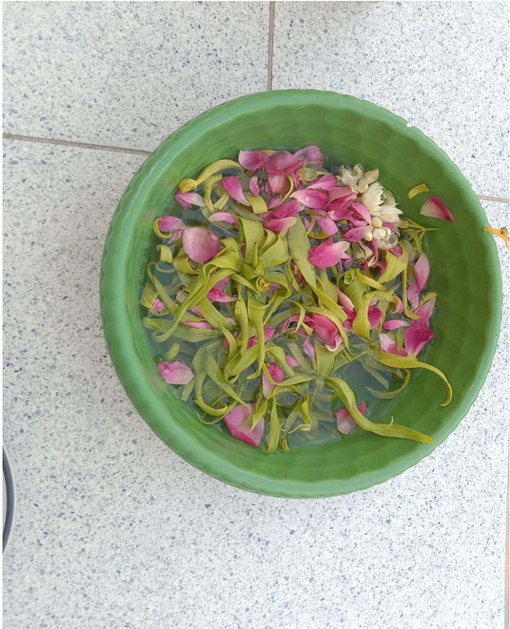
Air Kembang Untuk Memandikan Tombak Pusaka