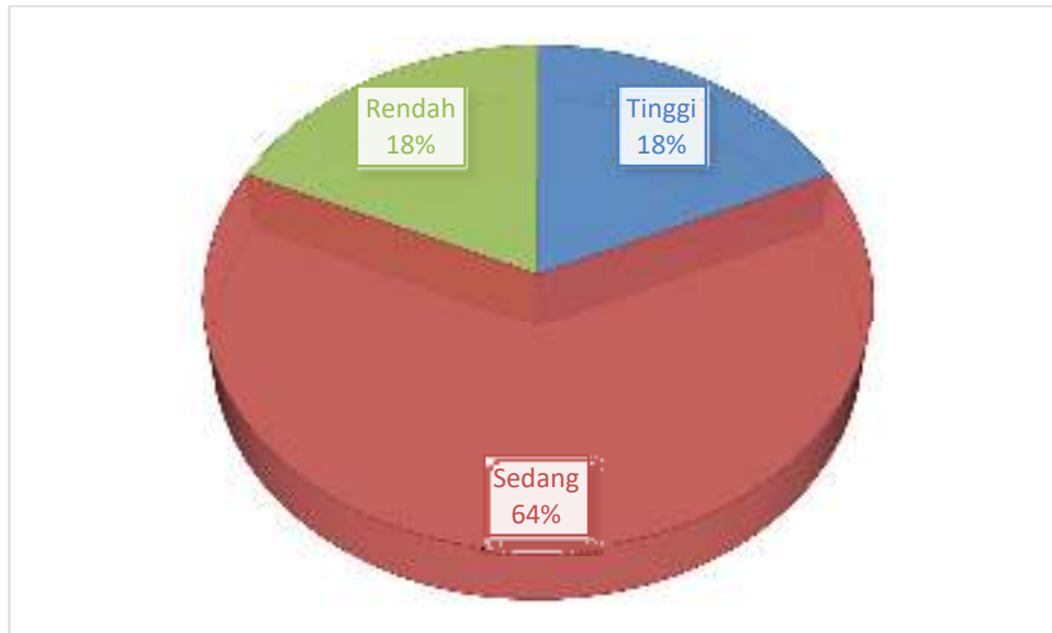
Gambar 4. 3 Grafik Kedisiplinan Santri

Berdasarkan grafik diatas maka dapat disimpulkan bahwasanya tingkat kematangan emosi dengan ketegorisasi tinggi 18% dari subjek penelitian, sedang 64% dari subjek penelitia serta 18% dari subjek penelitian untuk kategorisasi rendah.