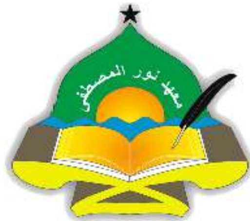
Gambar 4. 1 Logo Pondok Pesantren Terpadu Nurul Musthofa Tabalong