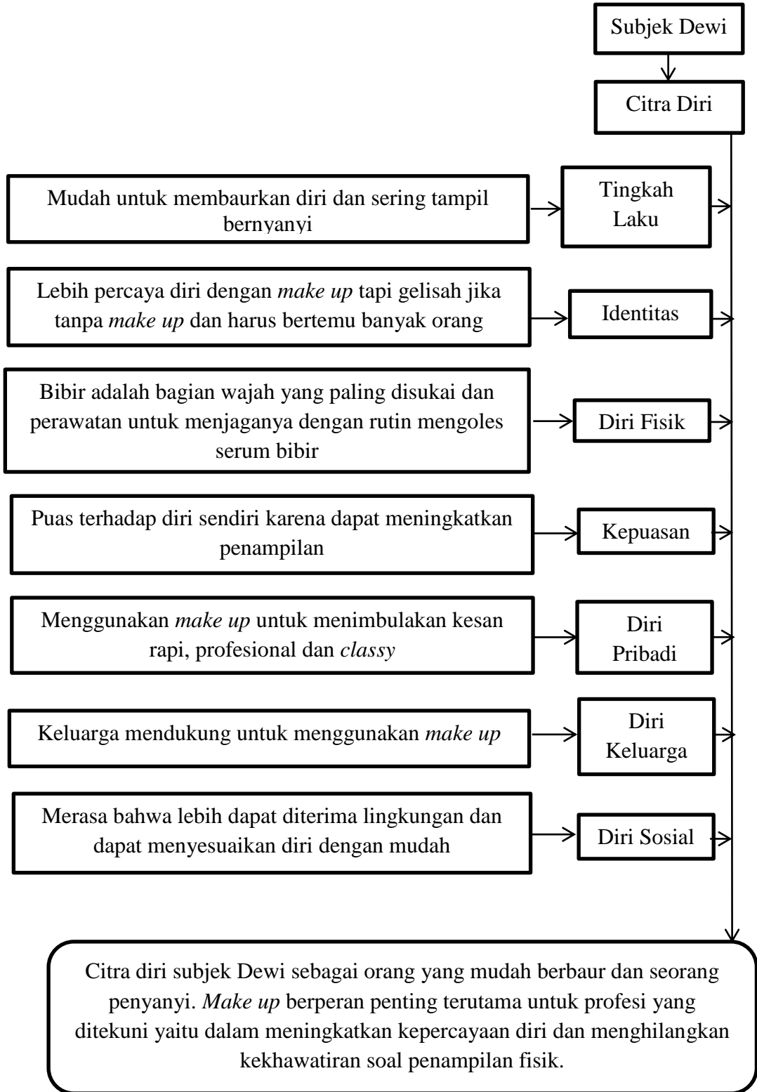
Skema 4.4 Pembentukan Citra Diri Subjek Dewi

dan seorang penyanyi. mempengaruhi pembentukan citra diri seseorang