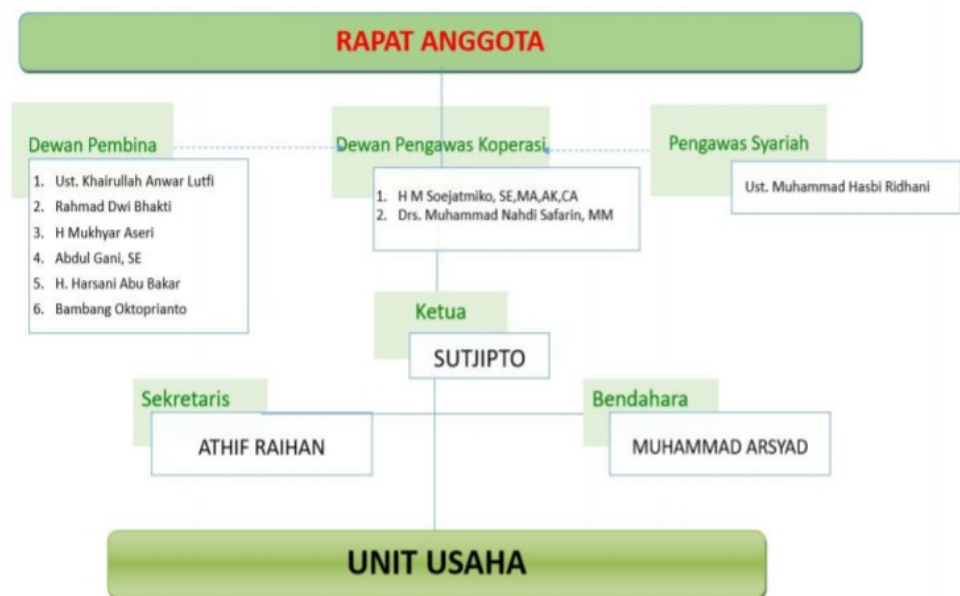
Gambar 4. 1 Struktur Organisasi Koperasi Konsumen Syariah Arrahmah Banjarmasin

Berikut ini merupakan struktur organisasi Koperasi Konsumen Syariah Arrahmah Banjarmasin: