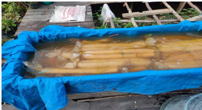
Gambar 4.4. Proses Perendaman Adonan yang Sudah Direbus

(Norma, personal communication, June 4, 2023)