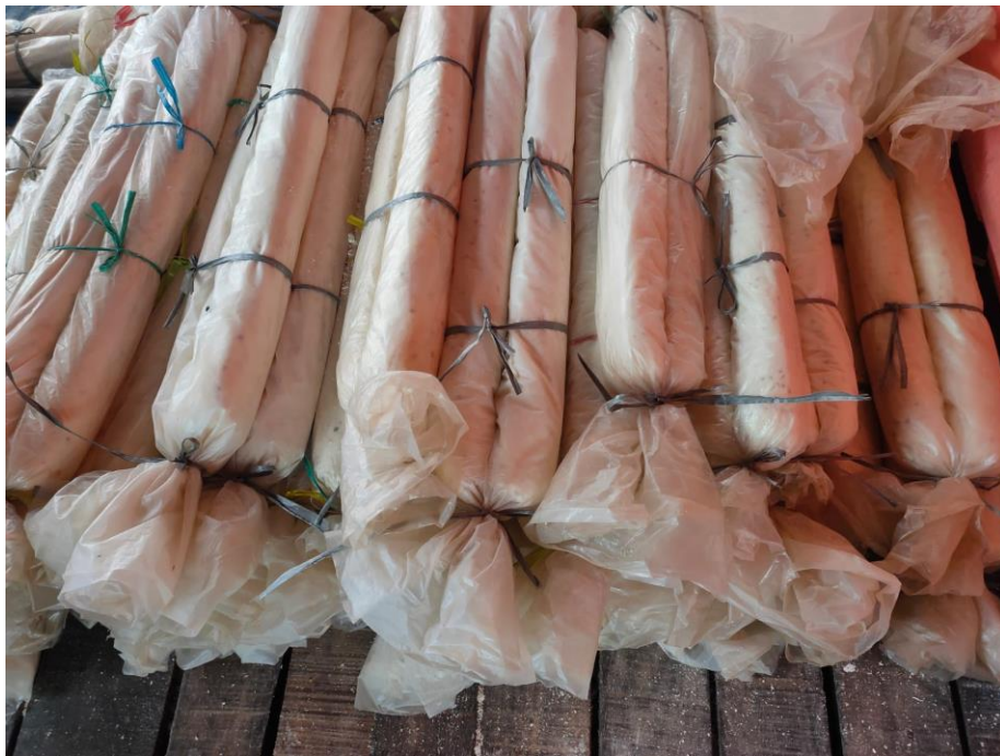
Gambar 4.2. Adonan Singkong Yang Siap Direbus

(Abdullah, personal communication, June 4, 2023)