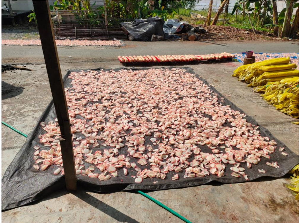
Gambar 4.7. Proses Penjemuran Kerupuk

(Syaiful, personal communication, June 4, 2023)