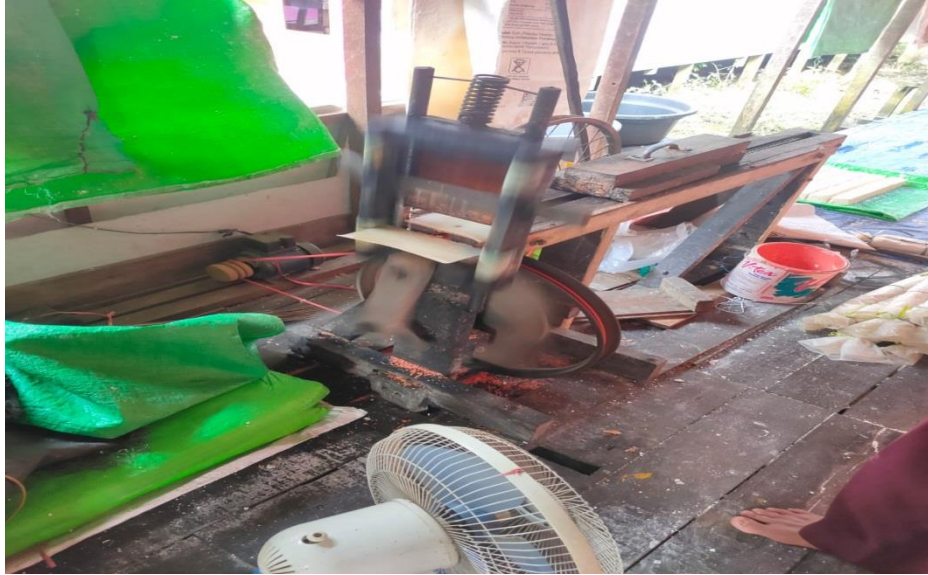
Gambar 4.6. Alat Pemotong Kerupuk

(Abdullah, personal communication, June 4, 2023)