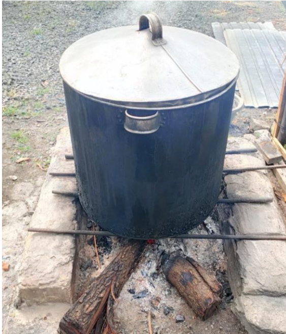
Gambar 4.3. Proses Perebusan Adonan Singkong

(Abdullah, personal communication, June 4, 2023)