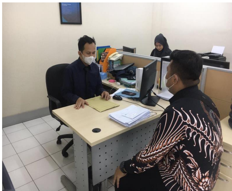
Foto Bersama Pimpinan dan Perwakilan Karyawan BSI KC Banjarbaru