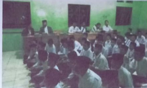
Gotong royong dan pengajian kitab Ihya Ulumuddin