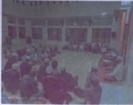
Rapat bersama OSDA dan apel pagi sabtu