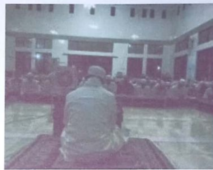
Memimpin Sholat Dhuha dan Mengawasi kegiatan giat prestasi