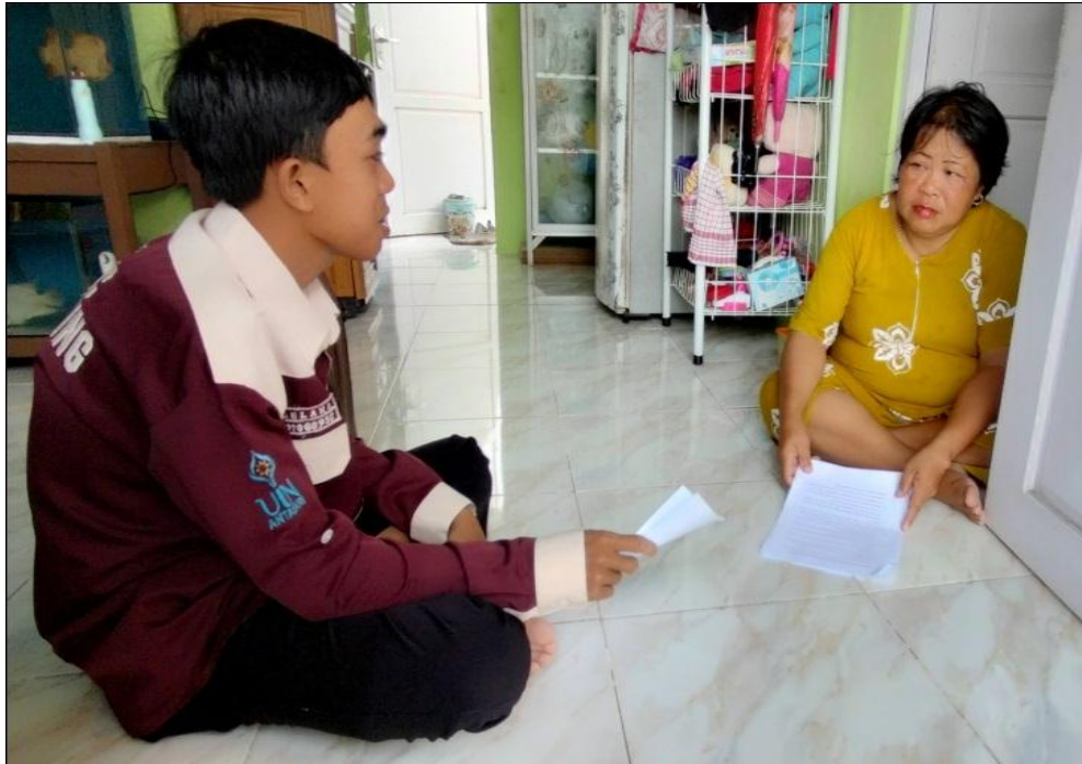
Gambar 5.2 Mama Dama