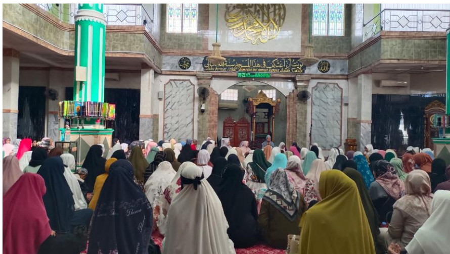
Observasi Pembelajaran di Majelis Muslimah At-Taqwa