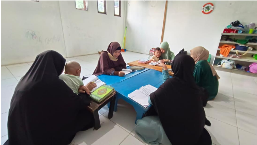
Observasi Pembelajaran di Yayasan Tahfizh Al-Qur'an Ummul Qura