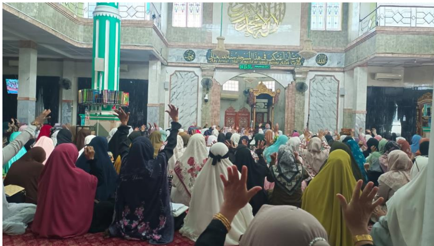
Observasi Pembelajaran di Majelis Muslimah At-Taqwa