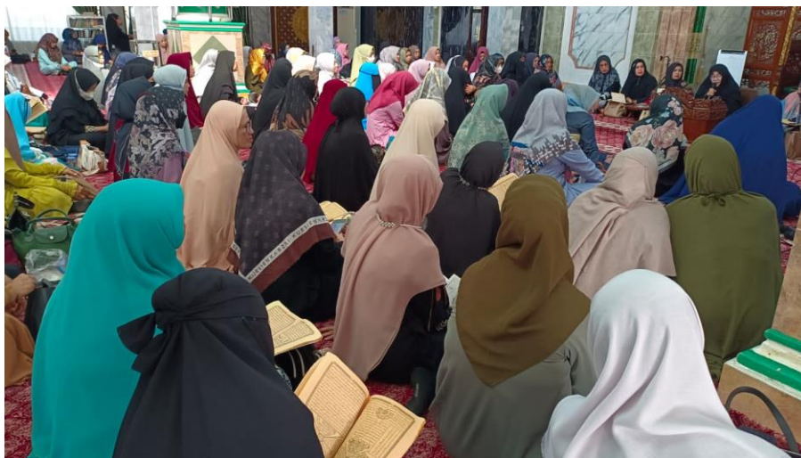
Observasi Pembelajaran di Majelis Muslimah At-Taqwa