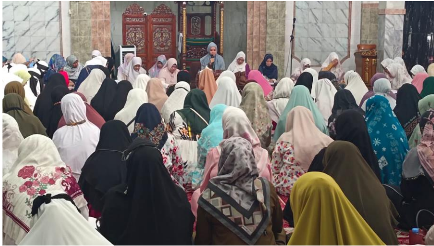
Observasi Pembelajaran di Majelis Muslimah At-Taqwa