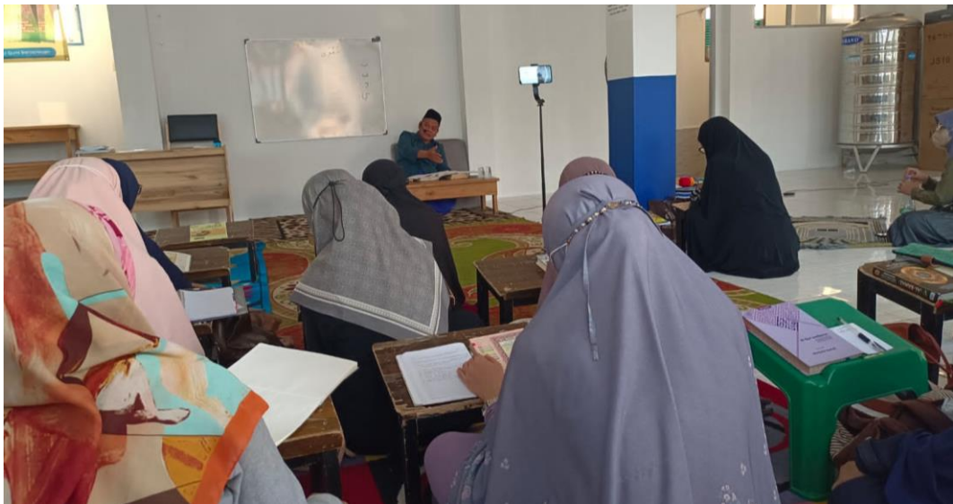
Observasi Pembelajaran di Yayasan Tahfizh Al-Qur'an Ummul Qura