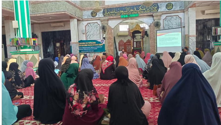
Observasi Pembelajaran di Majelis Muslimah At-Taqwa