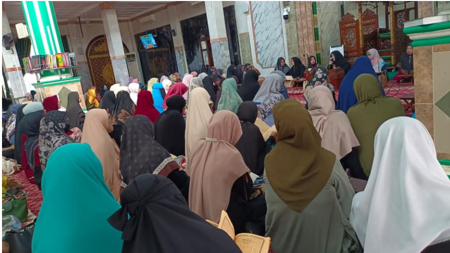
Observasi Pembelajaran di Majelis Muslimah At-Taqwa