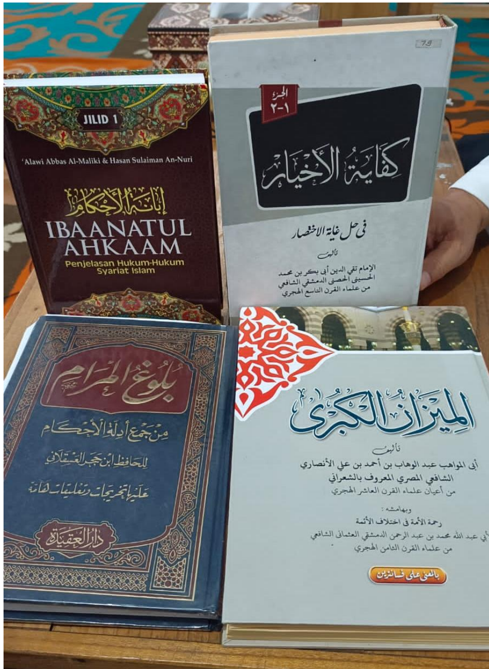
Kitab-Kitab Pembelajaran di Yayasan Tahfiz Al-Qur'an Ummul Qura