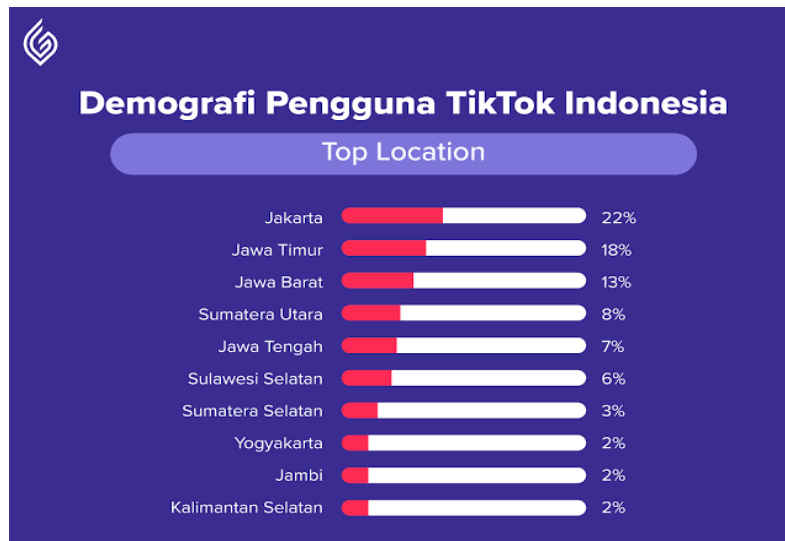
Gambar 1.1 Data Demografi Pengguna TikaTok di Indonesia

Berikut adalah gambar data demografi pengguna TikTok di Indonesia: