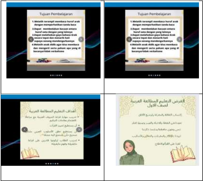
(٤) صفحة المواد الدراسية