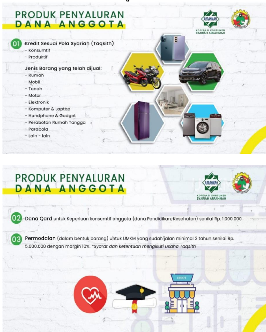
Gambar 4. 2 Produk Penyaluran Dana Anggota Koperasi Syariah Ar-Rahmah Banjarmasin