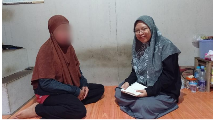
Wawancara dengan ibu SB