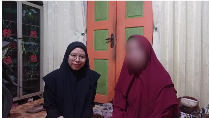
Wawancara dengan Ibu MS