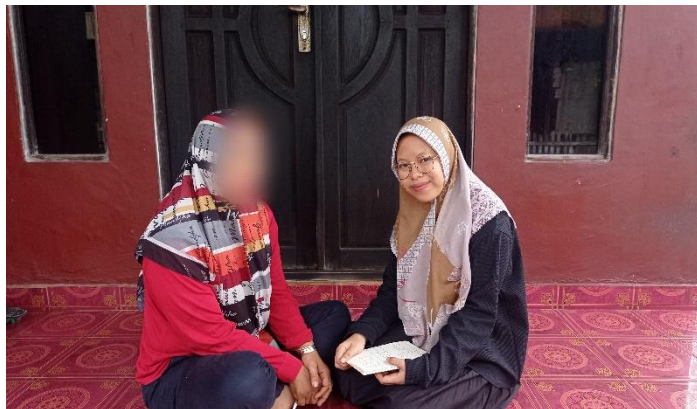
Wawancara dengan Ibu HR