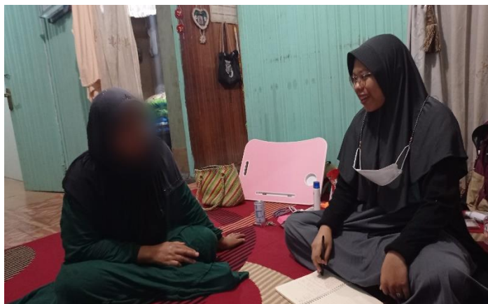
Wawancara dengan Ibu NA