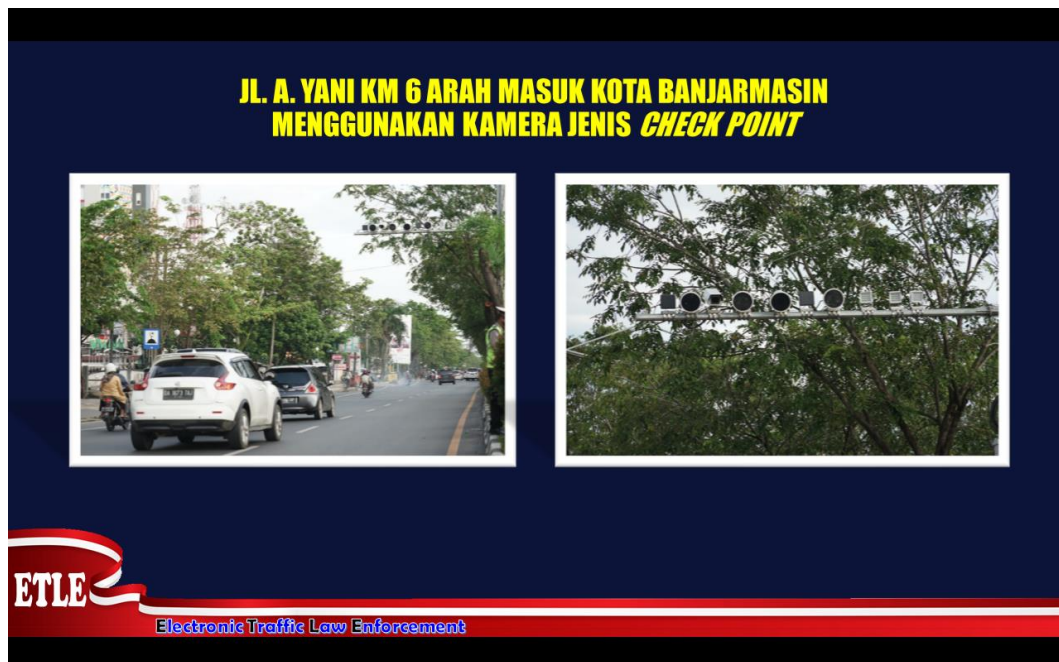
Gambar 4.3 kamera Etle Jl. A. Yani KM 6 Arah Masuk Kota

3. Jl. S.Parman, Simpang 4 Belitung Menggunakan Kamera Check Point.