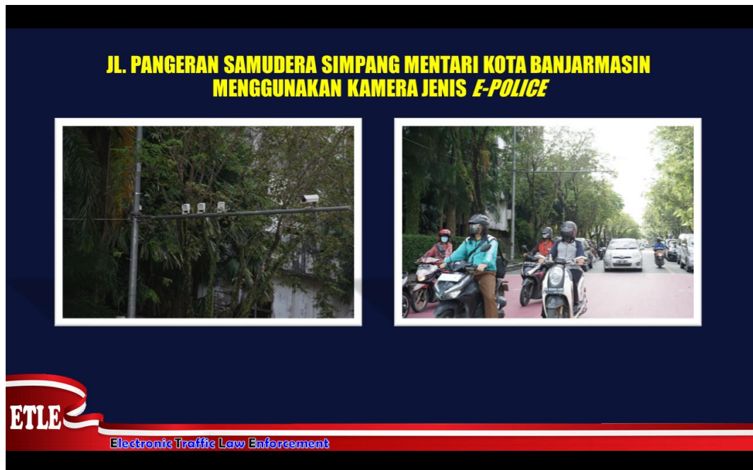
Gambar 4.6 Rencana Titik Pengembangan Kamera Etle