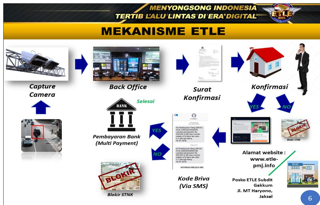
Gambar 4.2 Mekanisme Etle

Selanjutnya Penulis menanyakan “apa saja kendala yang terjadi pada peneraan e-tilang?”. Responden menjawab: kendala yang sering kali terjadi dalam melaksanakan program e-tilang ini yaitu gangguan sistem jaringan yang kurang baik. Selain jaringan kendala lain yang terjadi yaitu alamat pelanggar yang tidak lengkap, sehingga surat konfirmasi yang dikirmikan ke alamat tersebut kembali ke petugas dan gagal tersampaikan. Kendala lainnya seperti tingkat pengetahuan