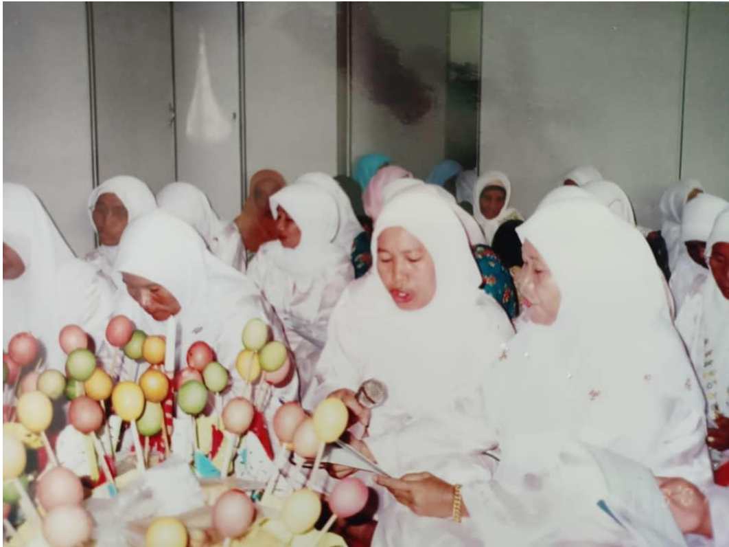
Ibu-ibu yang membaca Tahtim