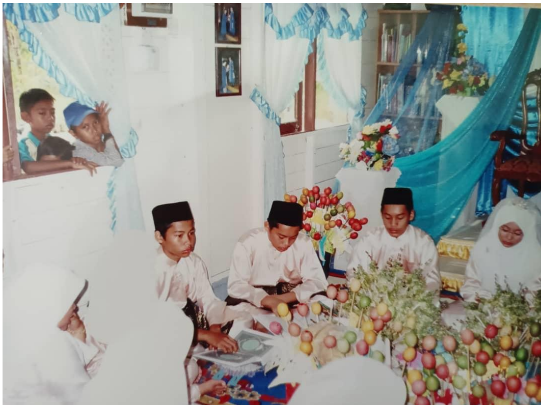
Anak-anak yang membaca Khataman al-Qur'an