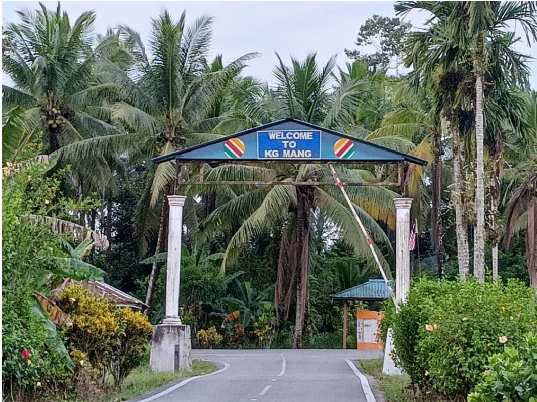
Gerbang Kampung Mang, Kota Samarahan