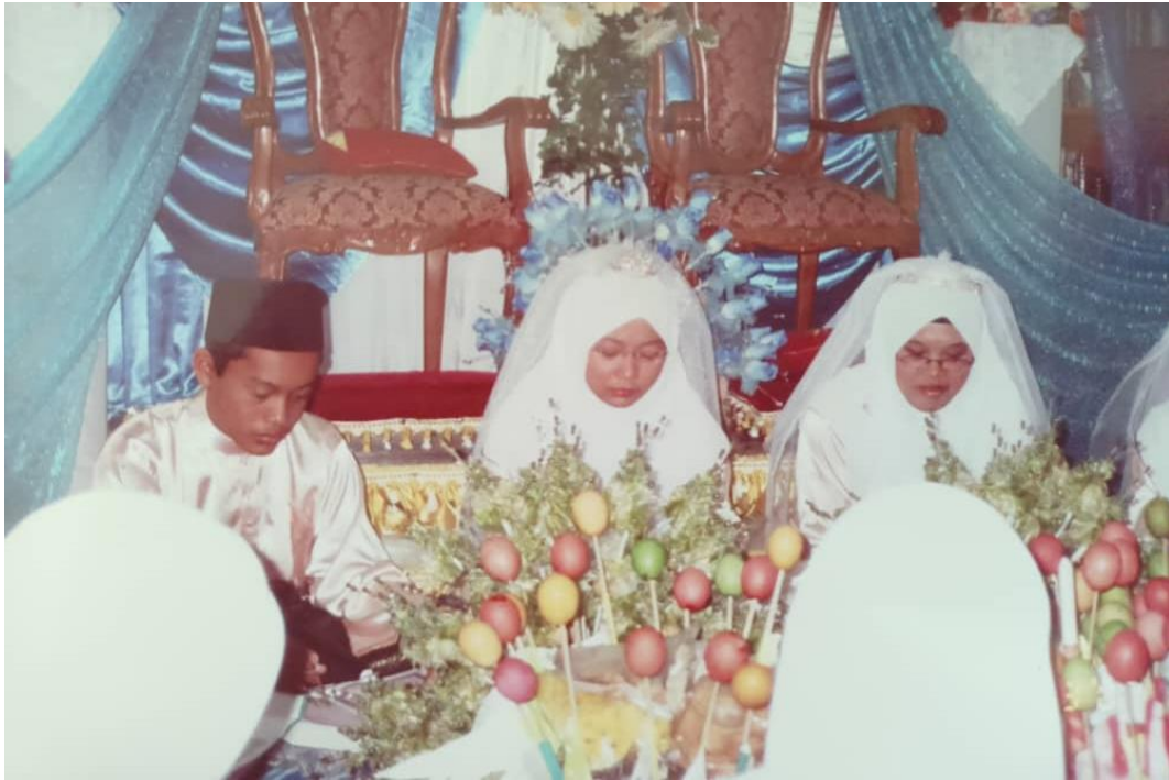
Khataman al-Qur'an membaca secara bergilir