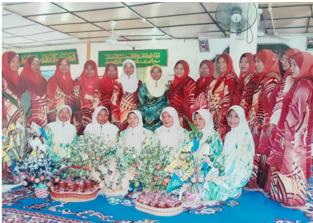
Ibu-ibu yang membaca Tahtim