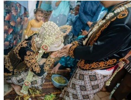
Prosesi Basuh Kaki dan Sungkem Kepada Pengantin Pria