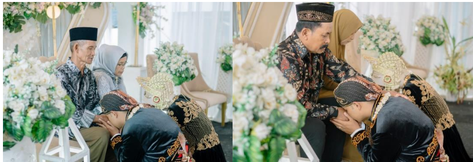
Sungkeman Kepada Orangtua Pihak Laki-laki dan Perempuan