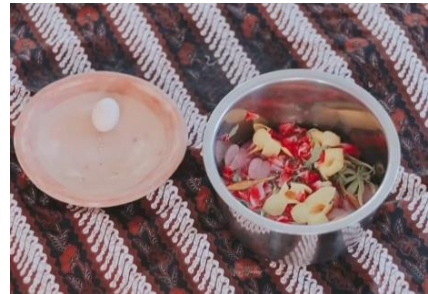
Bunga setaman, cobek dan telur ayam kampung