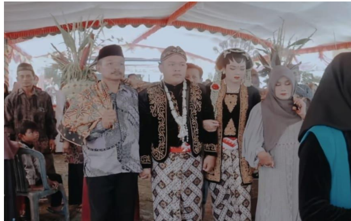
Pengantin Berjalan ke Pelaminan Digendong Orang Tua