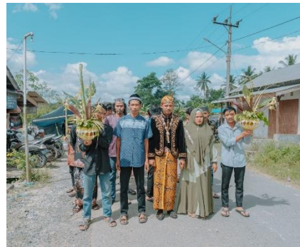
Rombongan Pengantin Didampingi Kembang Mayang