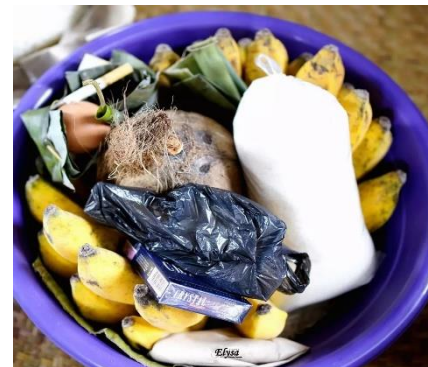
Contoh Hidangan Sesajen