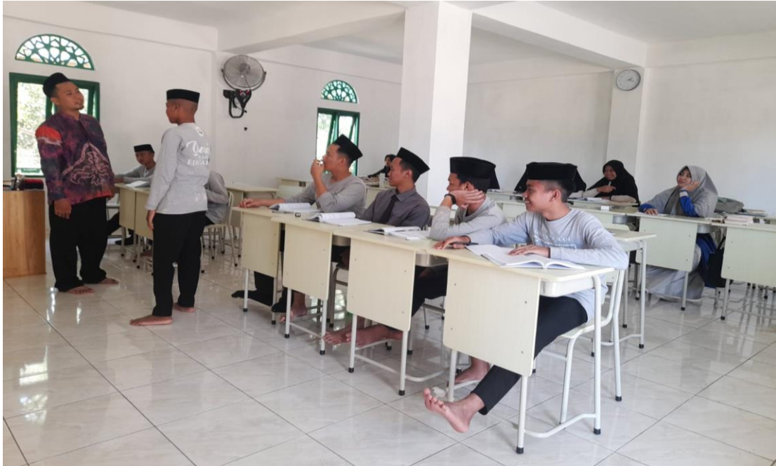
Wawancara dengan pimpinan pondok pesantren Tahfizh DQI