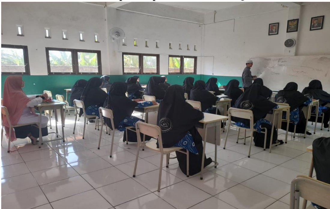
Observasi dikelas XII MA pondok pesantren Tahfizh DQI