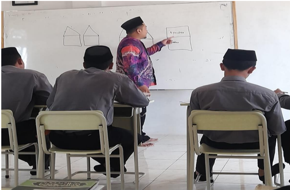
Observasi dikelas VIII SMP pondok pesantren Tahfizh DQI