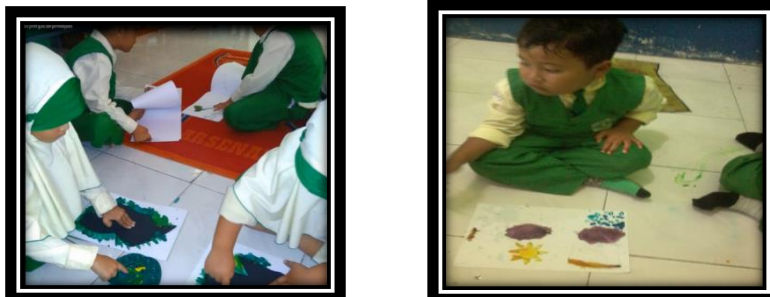
Gambar 4.6 Foto kegiatan di sentra seni

Sentra seni dibagi dalam seni musik, seni tari, seni kriya atau seni pahat. Sentra seni dikembangkan untuk menggali bakat, minat dan rasa estetika anak dalam bidang berkesenian, anak dapat mencurahkan kreatifitas tanpa batasan. Memiliki rasa seni yang tinggi selain mampu mengembangkan kemampuan motorik halus, keselarasan gerak, nada, aspek sosial-emosional dan seni juga dapat menjadikan pribadi yang lembut dan memiliki keluhuran budi.