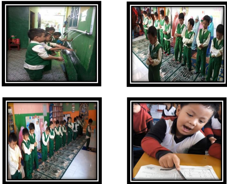
Gambar 4.4 Foto kegiatan di sentra ibadah

Sentra ibadah mengenalkan dasar-dasar ajaran agama islam yang diterapkan dalam kehidupan sehari-hari dan mengenalkan berbagai agama yang ada sebagai wujud dari sikap toleransi dan saling menghormati sebagai umat beragama. Kegiatan yang dikembangkan di sentra ibadah mengenalkan gerakan-gerakan