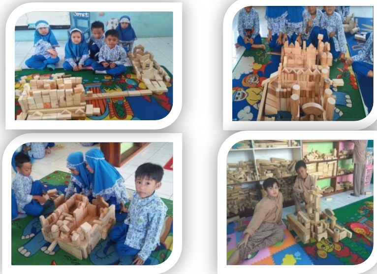
Gambar 4.1 Foto kegiatan di sentra balok

Sentra balok memfasilitas anak bermain tentang konsep bangun ruang, bentuk, ukuran, keterkaitan bentuk, kerapian, ketelitian, bahasa, kreatifitas dan mengembangkan matematik logik. Disentra balok anak dapat mengeksplor kemampuan imajinasinya.