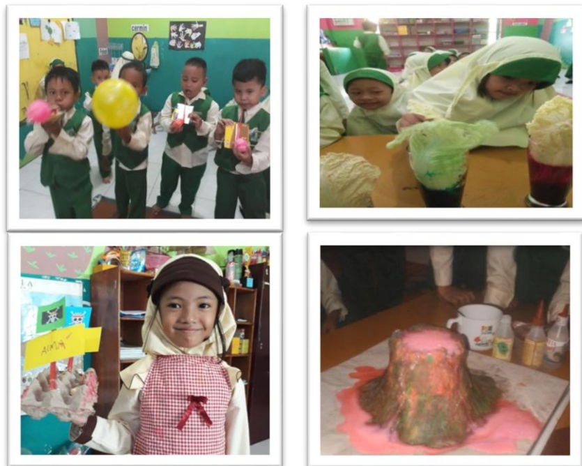
Gambar 4.5 Foto kegiatan di sentra alam dan sains

Sentra bahan alam dan sains kental dengan pengetahuan sains, matematika dan seni. Sentra bahan alam diisi dengan berbagai bahan main yang berasal dari alam, seperti air, pasir, bebatuan, daun. Disentra bahan alam anak memiliki kesempatan menggunakan bahan main dengan berbagai cara sesuai pikiran dan gagasan masing-masing dengan hasil yang berbeda.