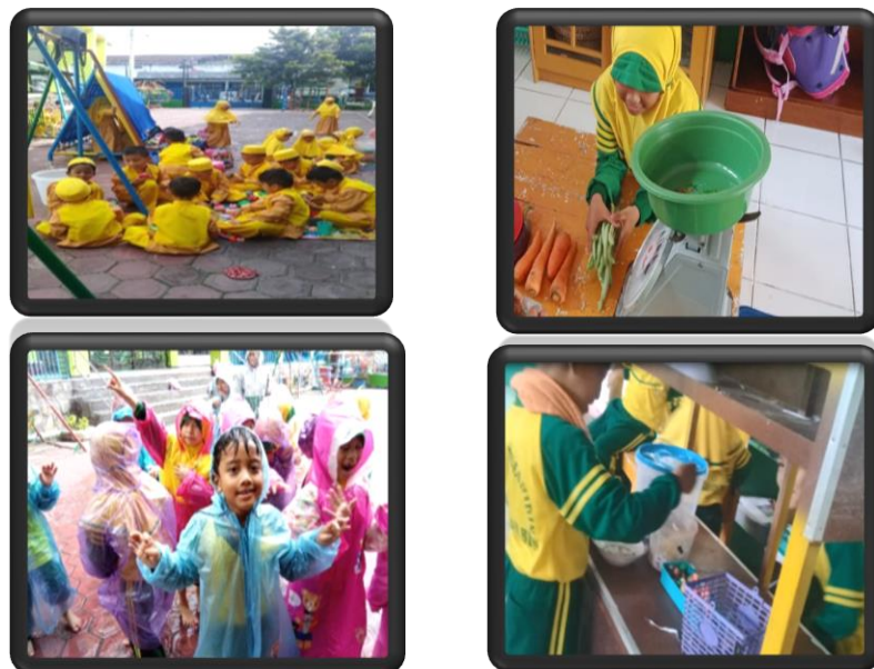
Gambar 4.3 Foto kegiatan di sentra peran