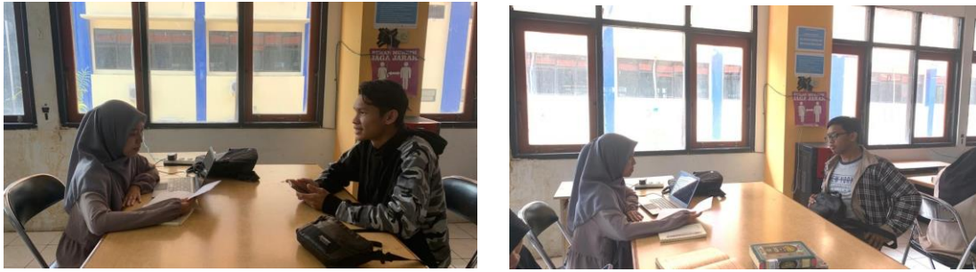
Wawancara dengan Mahasiswa Ilmu Al-Qur'an dan Tafsir angkatan 2020