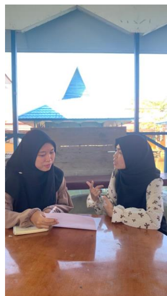
Wawancara dengan Mahasiswa Ilmu Al-Qur'an dan Tafsir angkatan 2019