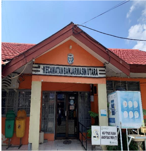
Gambar 3.1 Kantor Kecamatan Banjarmasin Utara