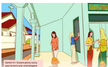
Gambar 5.12 Gotong Royong Membersihkan Tempat Ibadah Agama Lain