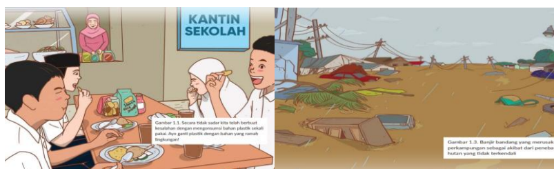
Gambar 5.1 Ilustrasi Sebab Akibat Perilaku Merusak Alam

Kecenderungan nilai-nilai Islam Wasathiyah yang diajarkan pada materi bab satu ialah nilai al-Ishlah (perbaikan). Ishlah mendorong untuk berlaku reformatif dan konstruktif dalam memperbaiki segala kerusakan baik kondisi umat maupun kerusakan lingkungan. Hal ini ditunjukkan pada materi pembahasan yang mengarahkan peserta didik untuk memulai langkah baik dari diri sendiri dalam melestarikan alam dan mencegah kerusakannya. Selain itu terdapat materi yang menjelaskan tentang peran manusia dalam menjaga lingkungan, banyak disajikan gambar ilustrasi tentang sebab akibat kerusakan alam, serta ilustrasi upaya pencegahan dan penanggulangannya. Gambar-gambar ilustrasi yang dimaksud adalah sebagai berikut.