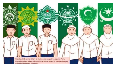
Gambar 5.13 Toleransi inter umat Islam

Aspek nilai Islam Wasathiyah yang termuat dalam materi bab delapan meliputi nilai tasamuh (toleransi), al-Muwathanah (cinta tanah air), dan al-La'unf (anti kekerasan). Sesuai dengan judul bab ini, nilai Islam Wasathiyah yang banyak dimuat adalah nilai tasamuh . Empat gambar di atas mengandung pengajaran nilai