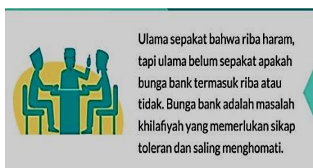
Gambar 5.14 Infografis Bab 9

Aspek nilai Islam Wasathiyah yang termuat dalam materi bab sembilan adalah nilai tasamuh (toleransi). Meski hanya memuat satu aspek nilai, muatan nilai tasamuh disampaikan secara kompleks, seperti melalui infografis, gambar ilustrasi, materi dan rubrik lainnya.