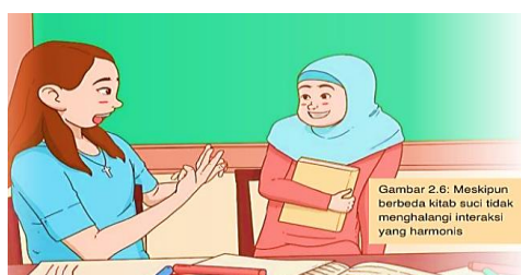
Gambar 5.3 Ilustrasi Sikap Tasamuh

Aspek nilai-nilai Islam Wasathiyah yang termuat dalam materi bab dua meliputi nilai tasamuh (toleransi), al-Qudwah (kepeloporan), i'tidal (adil dan proporsional), al-La'unf (anti kekerasan) dan al-Muwathanah (cinta tanah air).