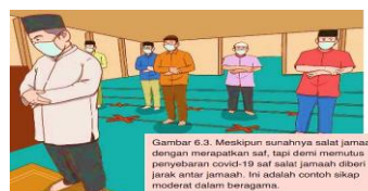
Gambar 5.7 Sikap Moderat Dalam Beragama