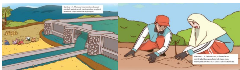
Gambar 5.2 Ilustrasi Perilaku Melestarikan Alam