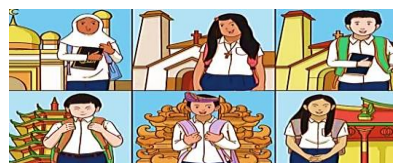
Gambar 5.11 Toleransi Antar Umat Beragama