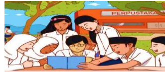
Gambar 6.4. Sikap moderat akan mendorong sikap saling menghargai dan menghormati antar suku, agama, ras, dan golongan