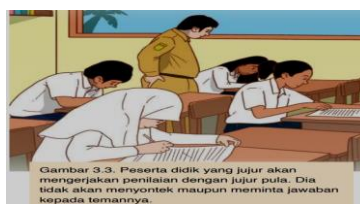
Gambar 3.3. Peserta didik yang jujur akan mengerjakan penulisan dengan jujur pula. Dia tidak akan menyontek maupun meminta jawaban kepada temannya.