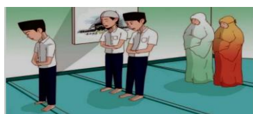
Gambar 3.1. Ibadah merupakan amanah yang diberikan Allah kepada manusia. Amanah ini harus dijaga dan dijalankan dengan sebaik-baiknya.

qudwah dapat diartikan sebagai sikap memberi teladan yang baik. Muatan nilai qudwah secara kompleks dimuat dalam materi yang disajikan melalui gambar ilustrasi, dalil ayat dan hadis, kisah Rasul, dan pada rubrik lainnya.