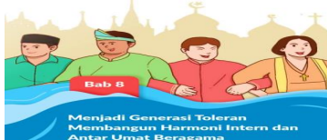
Gambar 5.10 Ilustrasi Pada Judul Bab 8