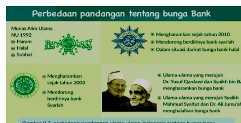
Gambar 5.15 Perbedaan Pandangan Tentang Bunga Bank