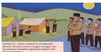
Gambar 5.6 Sikap Moderat di Kehidupan Sehari-Hari