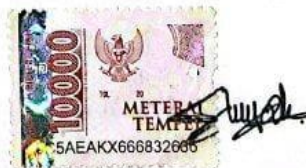
Siti Sya'idah Salsabila

Banjarmasin, 28 September 2023 Yang membuat pernyataan