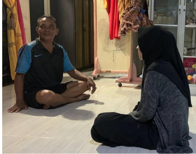
Wawancara dengan informan tanggal 11 Mei 2023