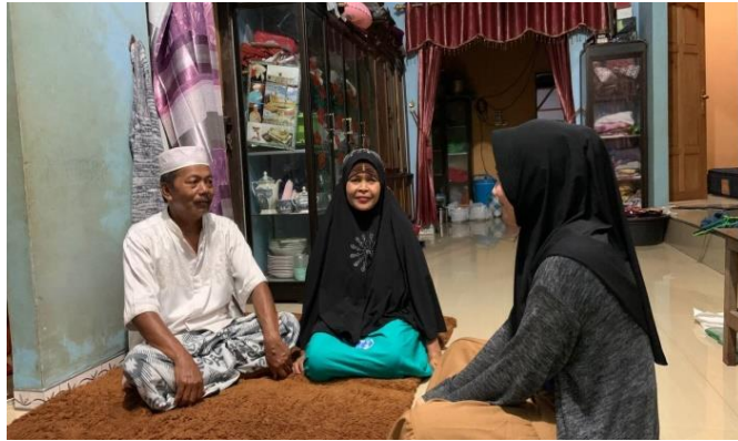
Wawancara dengan informan tanggal 17 Mei 2023