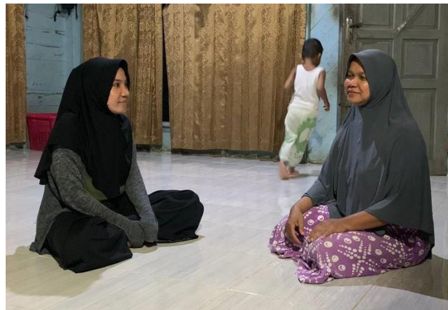
Wawancara dengan informan tanggal 13 Mei 2023