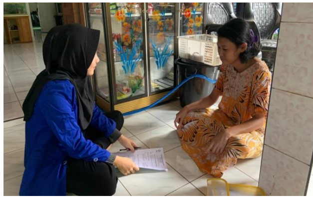
Wawancara dengan informan tanggal 19 Mei 2023