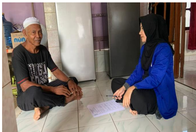
Wawancara dengan informan tanggal 13 Mei 2023