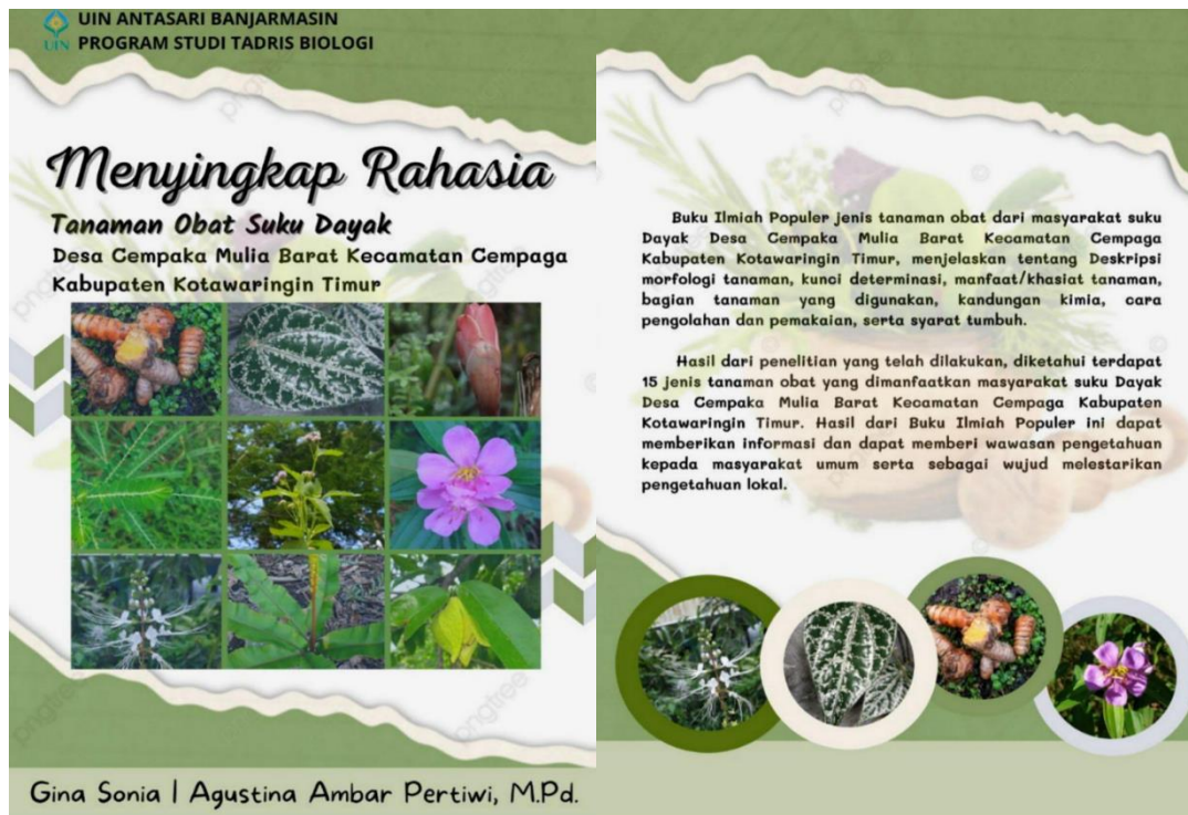
Gambar 3. 1 Desain Cover BIP (Dok.Pribadi, 2022)

Adapun desain cover buku ilmiah populer sebagai berikut: