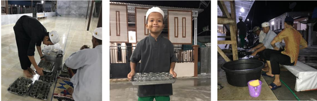
Anak-anak panti sedang ikut membantu mempersiapkan Majelis Ta'lim