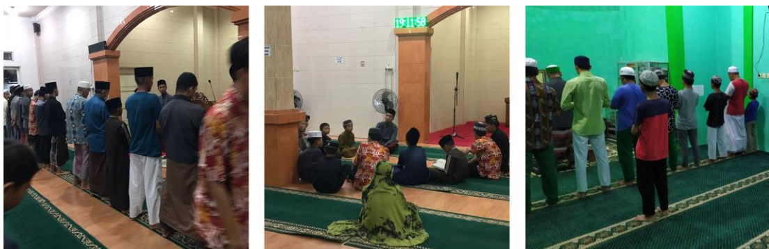
Kegiatan sholat berjama'ah dengan pengasuh