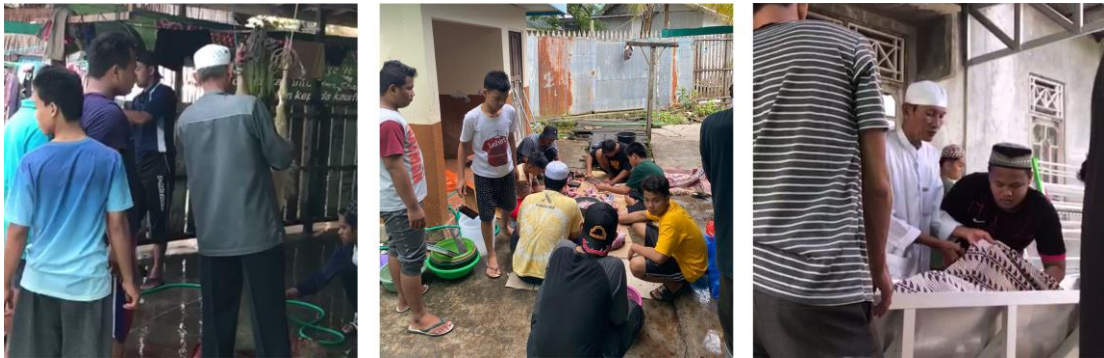
Pengasuh membimbing kegiatan keagamaan seperti memandikan jenazah dan membersihkan hewan qurban