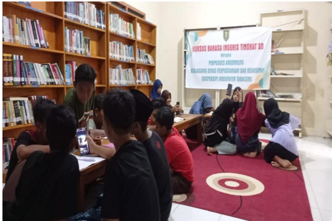
Kegiatan Kursus Bahasa Inggris Tingkat SD