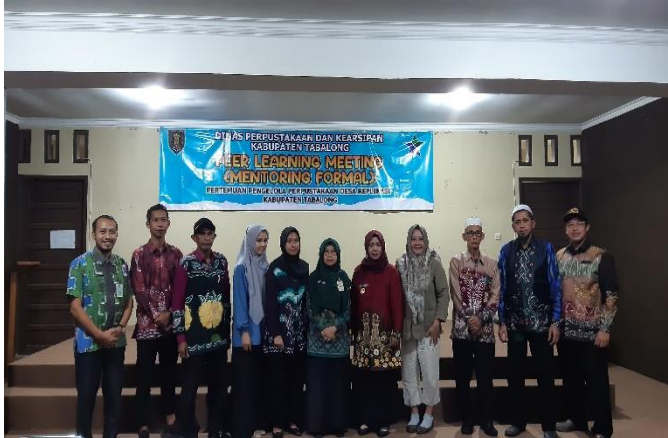
Kegiatan Peer Learning Meeting