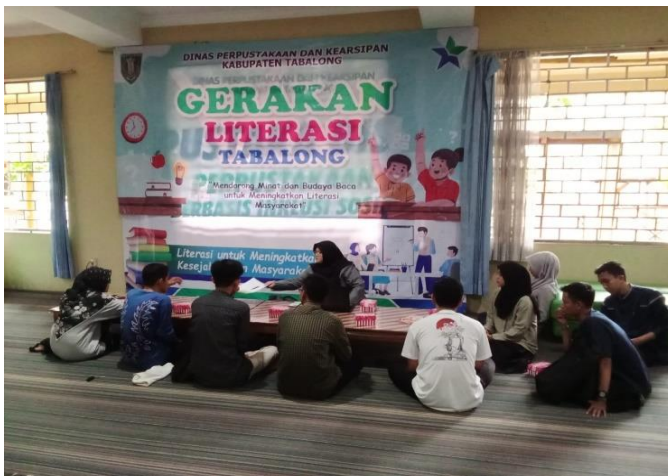
Kegiatan Gerakan Literasi Tabalong