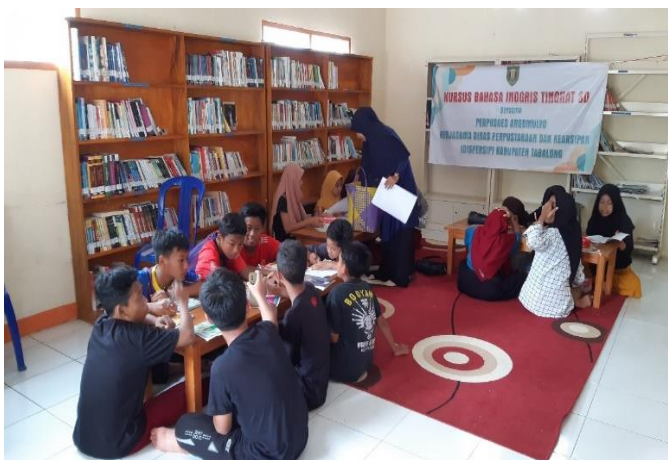
Kegiatan Kursus Bahasa Inggris Tingkat SD