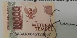
Febryadi Sidiq Adha

Banjarmasin, 25 September 2023 Yang membuat pernyataan,