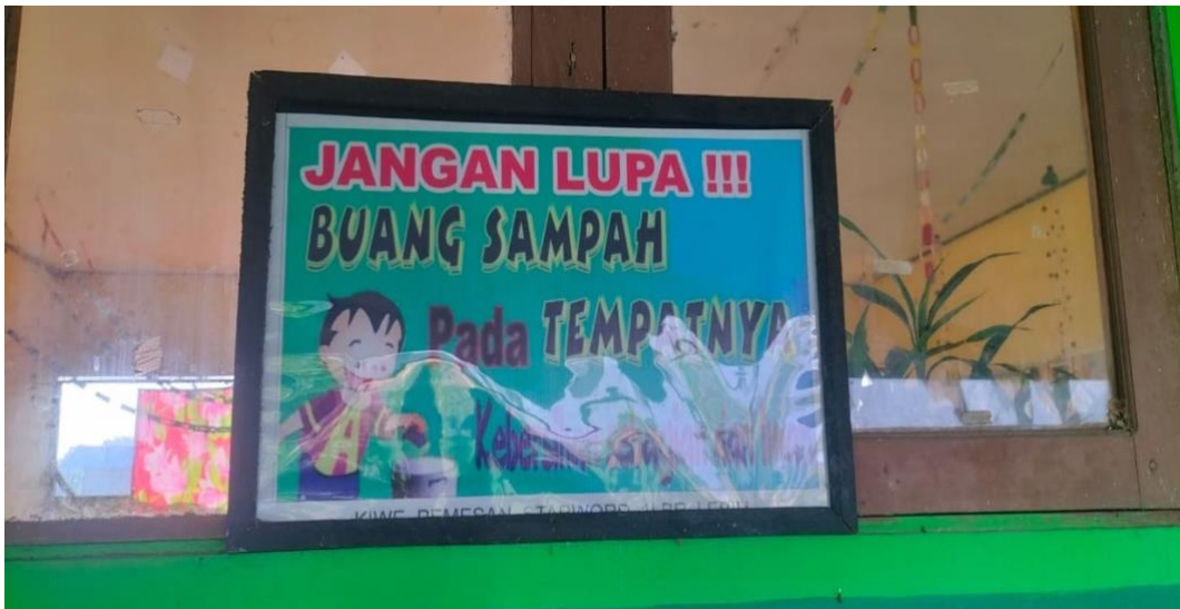
Himbauan kepada siswa agar selalu menjaga kebersihan lingkungan