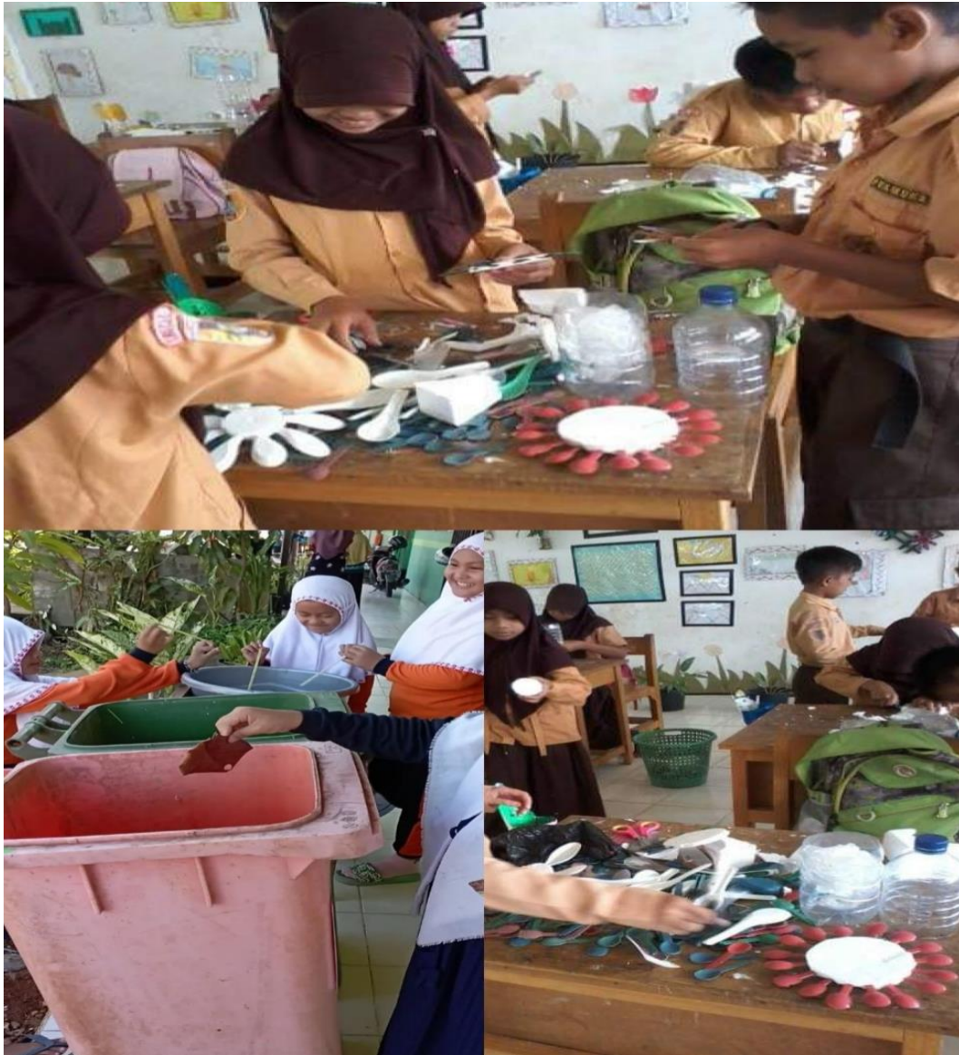
Siswa melaksanakan piket kebersihan dan juga membuat kerajinan dari bahan daur ulang