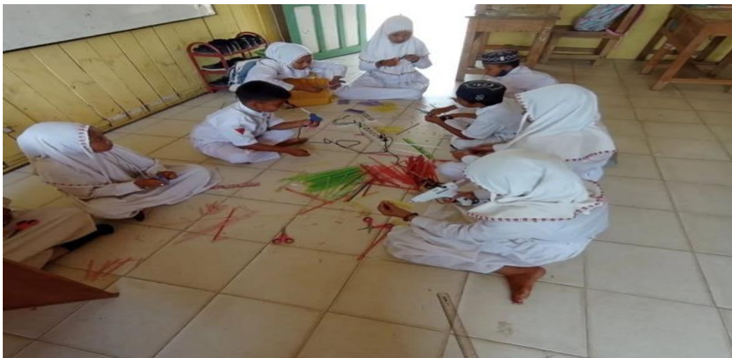
Siswa kelas 4 membuat kerajinan dari bahan sedotan plastik