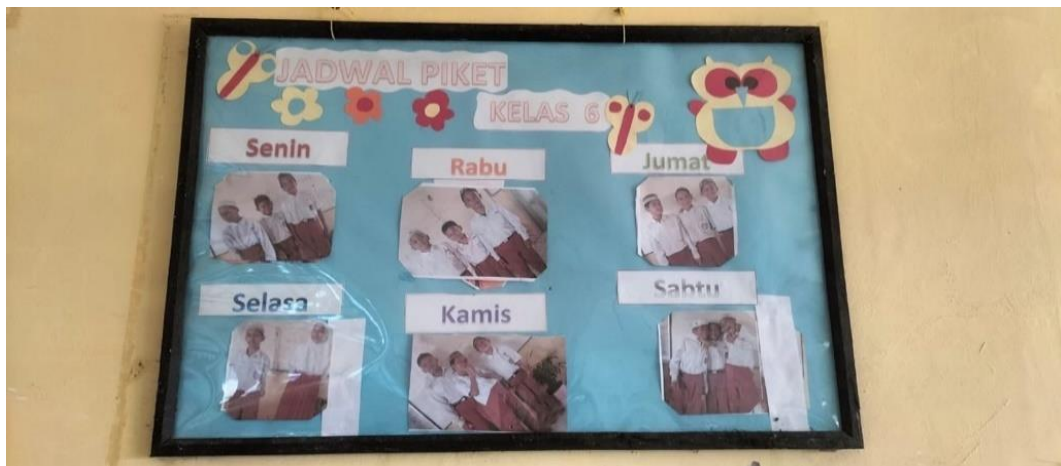
Jadwal piket kebersihan kelas 4, 5 dan 6 SDN Pejambuan