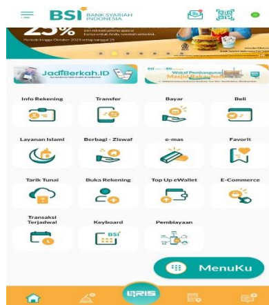
Gambar 4.1 Tampilan Aplikasi BSI Mobile