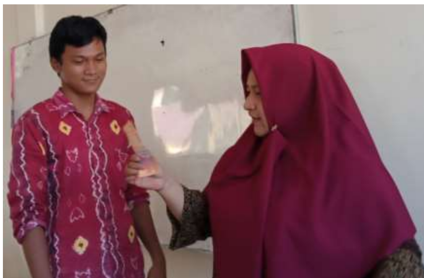
Gambar 4. 5 Guru Memberikan Apresiasi Sebagai Bentuk Motivasi Bernalar Kritis Siswa

terhadap materi yang telah dipelajari. Kuis disajikan dalam bentuk link yang bagikan melalui grup whatsapp yang bisa diakses melalui laman internet. Guru memberikan hadiah kepada siswa yang menjawab pertanyaan yang paling banyak dengan memberikan uang Rp. 10.000,-.