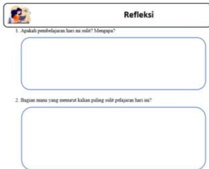
Gambar 4. 6 Pertanyaan Refleksi yang Mengharuskan Siswa Bernalar Kritis yang diambil dari LKPD

Berdasarkan yang peneliti amati refleksi peserta didik terlampir pada LKPD. Guru memberikan refleksi kepada siswa dalam bentuk wawancara dengan 2 pertanyaan yang akan dijawab siswa.