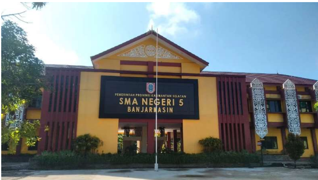
Gambar 4. 1 Sekolah SMA Negeri 5 Banjarmasin

SMA Negeri 5 Banjarmasin adalah salah satu SMA Negeri terbaik di Banjarmasin. Meluluskan alumni pertama pada tahun 1982 dan hingga tahun 2021 telah meluluskan 39 angkatan alumni. Salah satu alumni angkatan ke-7 menjadi orang nomor 1 di Kalimantan Selatan periode 2016-2021. Sekolah ini telah menjadi sekolah Adiwiyata Nasional sejak tahun 2016.