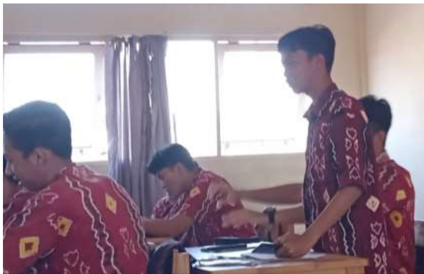
Gambar 4. 4 Siswa Memberikan Pertanyaan sebagai Bentuk Karakter Bernalar Kritis

Jika bernalar kritis siswa kurang maka guru memberikan arahan dan motivasi agar siswa dapat bernalar kritis dengan baik. Hal ini dapat dilihat pada saat peneliti mengadakan observasi. Guru memberikan kesempatan kepada siswa untuk bertanya atau memberi tanggapan kepada kelompok yang presentasi. Walaupun pada awal-awal siswa terlihat kurang aktif hanya beberapa saja yang bertanya. Setelah guru memberikan arahan dan motivasi kepada siswa untuk bertanya atau memberikan tanggapan siswa menjadi lebih aktif. Bahkan ada siswa yang tidak sempat untuk bertanya dikarenakan keterbatasan waktu dalam presentasi kelompok.