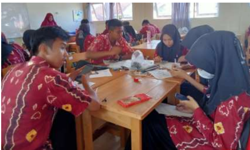
Gambar 4. 3 Siswa Menyelesaikan Tugas Kelompok sebagai Bentuk Karakter Gotong Royong

Pada saat siswa berdiskusi guru berkeliling mengamati bagaimana mereka menyelesaikan LKPD sekaligus menilai sikap siswa sesuai dengan rubrik penilaian sikap. Jika ada siswa yang kurang aktif dalam diskusi maka guru akan memberikan motivasi agar siswa tersebut ikut berperan aktif dalam diskusi kelompok.