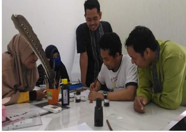
المعلم يصحح كتابة الطلاب