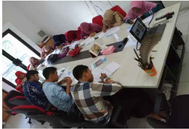
تعليم الخط العربي في مدرسة خط القرآن بنجر باروا