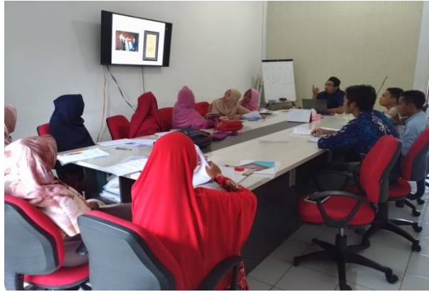
شرح المعلم باستخدام الشاشة