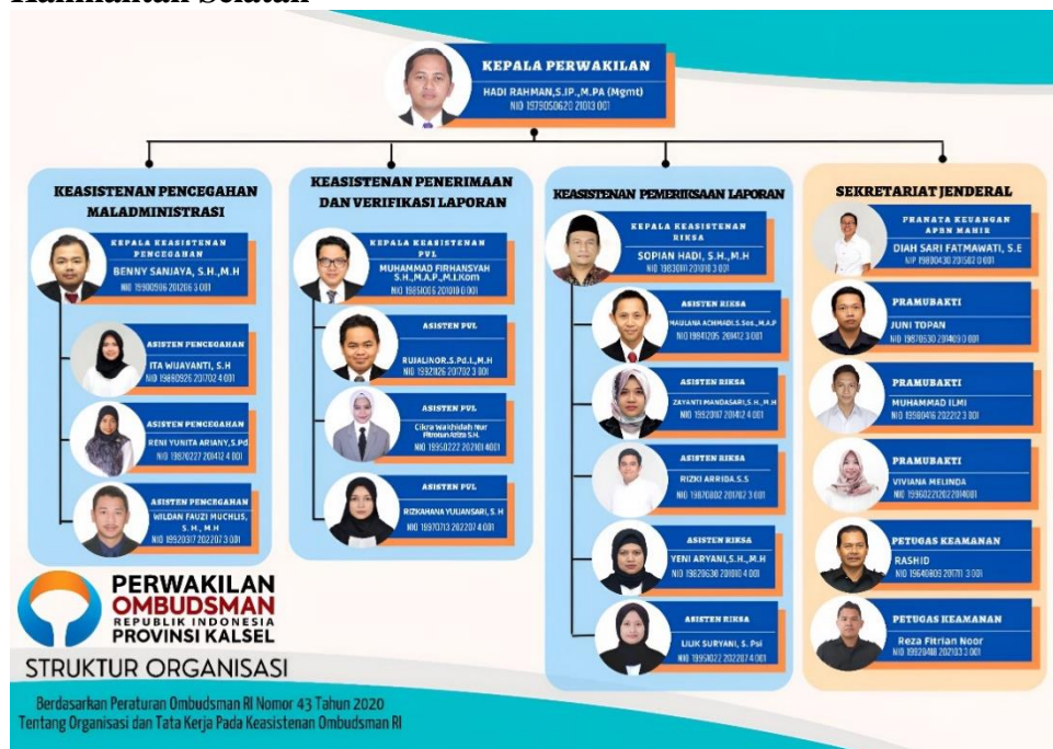
Gambar 4.1 Struktur Organisasi Ombudsman RI Perwakilan Kalimantan Selatan