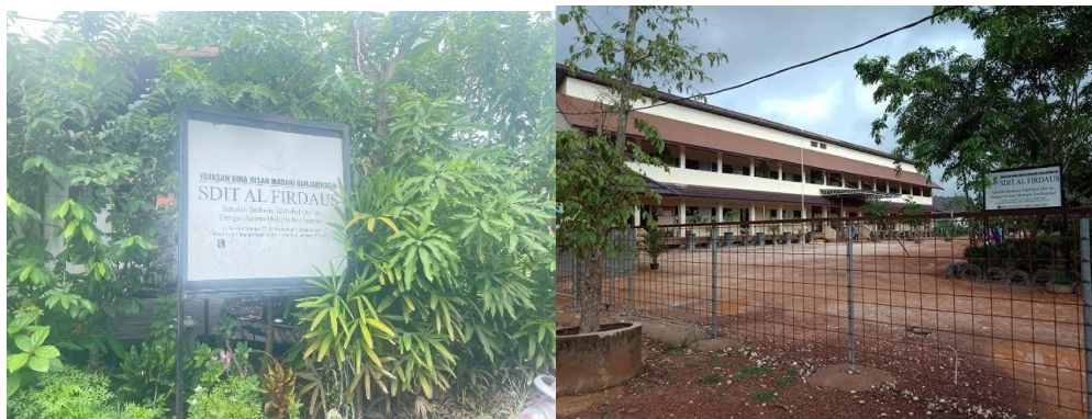
Gambar 4.6 Gedung SDIT Al-Firdaus Banjarmasin

SDIT Al-Firdaus sudah mengantongi Akreditasi A. Sistem pendidikan yang diterapkan adalah full day school untuk menjamin proses pembelajaran yang interaktif, integratif, dan produktif dengan meliputi mata pelajaran umum dan pelajaran agama Islam serta dengan nilai tambah program menghafal Al qur'an bagi seluruh siswa.