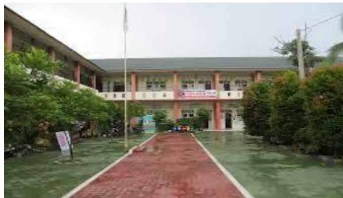
Gambar 4.2 Gedung SDIT Robbani Banjarbaru

SDIT Robbani Banjarbaru resmi terdaftar di dinas pendidikan dengan ijin operasional nomor 038 Tanggal 12 Juni 2009, NSS Nomor 102156106002 dan NPSN nomor 30312235. Selain itu SDIT Robbani Banjarbaru juga terdaftar sebagai anggota Jaringan Sekolah Islam Terpadu Indonesia dengan nomor anggota 5.63.62.02.001.