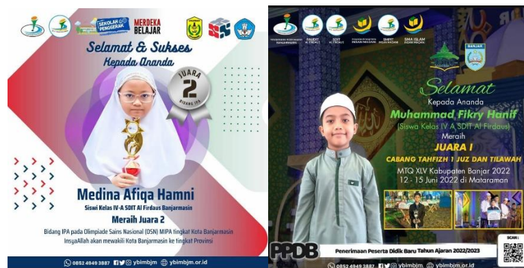
Gambar 4.8 Prestasi SDIT Al-Firdaus Banjarmasin