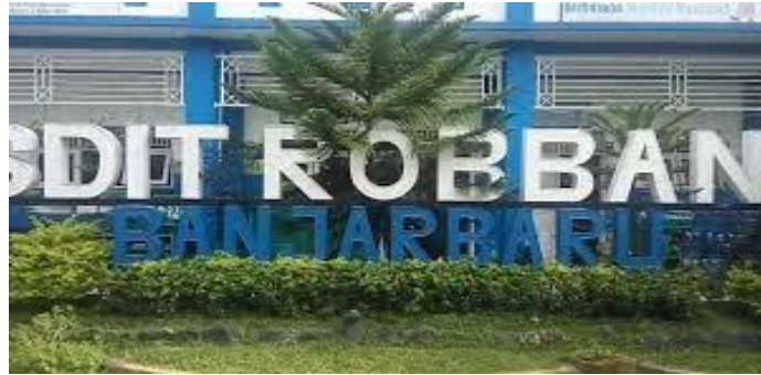
Gambar 4.1 Gedung SDIT Robbani Banjarbaru