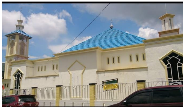
Gambar 4.4 Mesjid SDIT Robbani Banjarbaru

Ruang kelas diisi dengan rata-rata 24 siswa, sehingga jika ditotal seluruh siswa aktif yang terdata saat ini mencapai 689 orang. Mereka semua dididik oleh 79 orang guru pengajar.