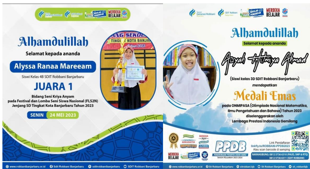
Gambar 4.5 Prestasi SDIT Robbani Banjarbaru