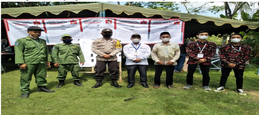
Keterangan: foto bersama Bapak Camat Kec. Banjang , Bhabinkabmtimas Kec. Banjang, dan Panitia Pilkdes Pawalutan tahun 2021