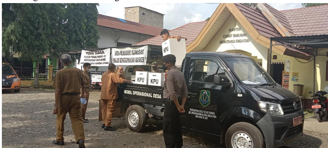
Keterangan: Pengambilan Kotak Suara Dikecamatan Banjang Kabupaten Hulu Sungai Utara