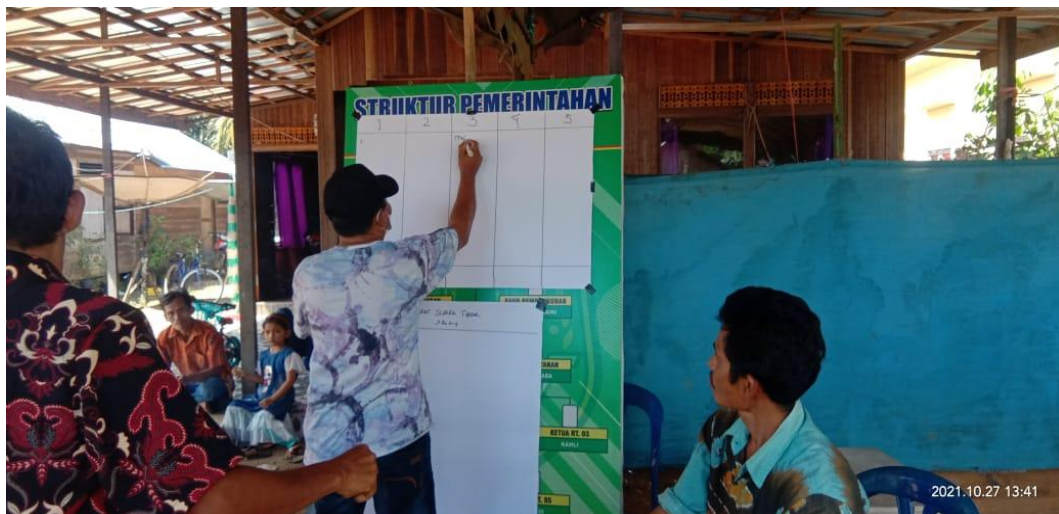
Keterangan: Proses Perhitungan Suara TPS 2