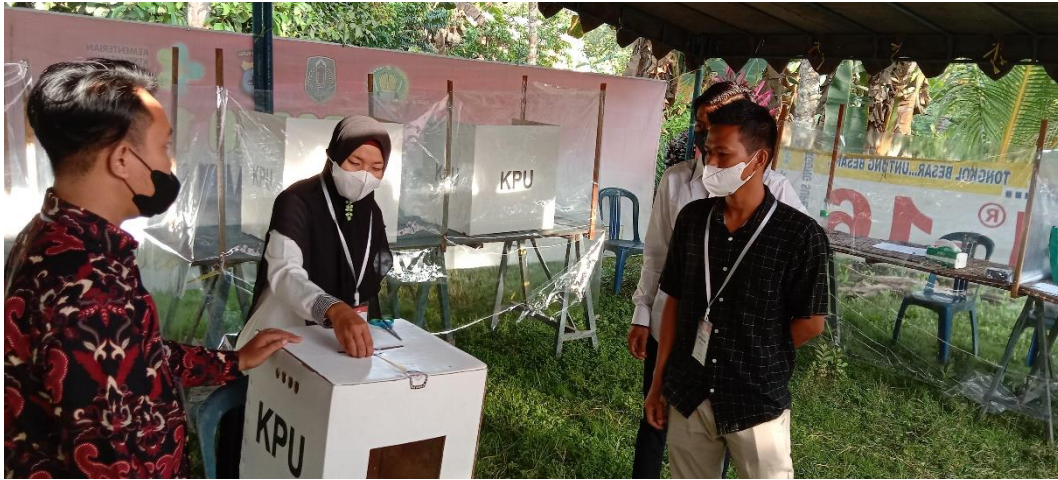
Keterangan: Proses Pemungutan Suara di TPS