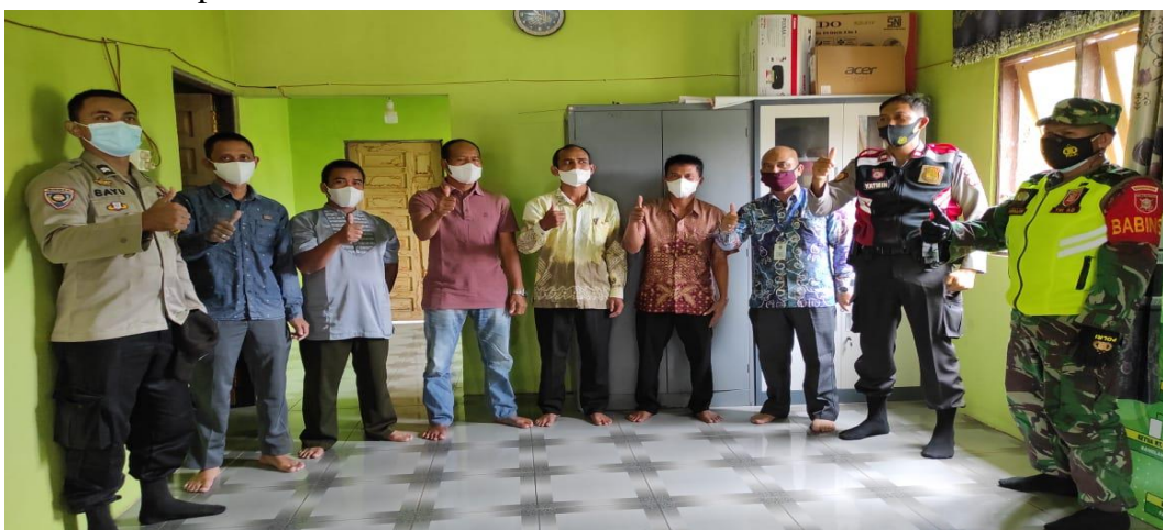
Keterangan: Foto Para Calon Kepala Desa Pawalutan, Camat, Babinsa dan Bhabinkamtibmas Kecamatan Banjarmang Kabupaten Hulu Sungai Utara.