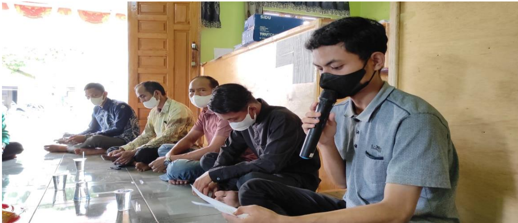
Keterangan : Sosialisasi Pelaksanaan Pemilihan Kepala Desa Kepada Masyarakat dan Calon Kepala Desa Pawalutan.