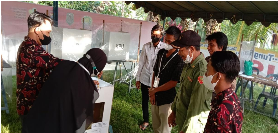
Keterangan: Proses pembukaan kotak suara