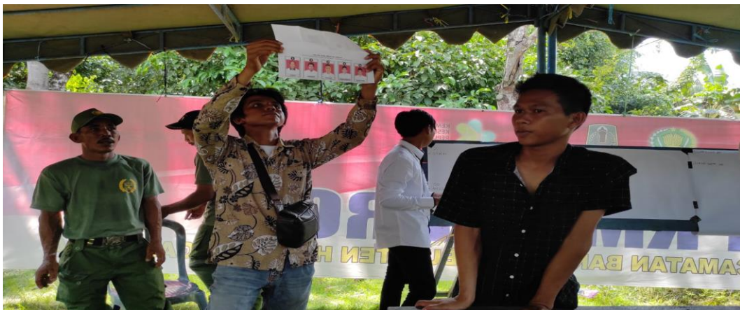
Keterangan: Proses Perhitungan Suara TPS 1