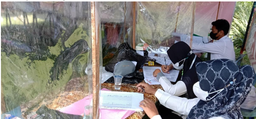
Keterangan: Proses pengisian dan verifikasi berkas pemungutan suara